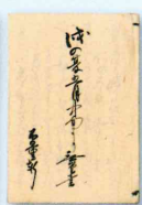
「戊の夏五月中旬より無た書」