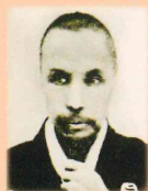
国立国会図書館「近代日本人の肖像」より