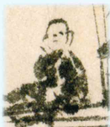
「不量老自画賛」より

自伝『夢酔独言』で知られる海舟の父・小吉。貧乏旗本で幕府での出世は叶いませんでしたが、江戸下町を舞台に豊かな人脈を築き、人望を集めました。小吉最晩年の日記からは、蘭学に勤む息子の姿が垣間見えます。