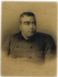
西郷隆盛肖像画複製