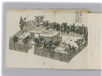
西郷隆盛奄美大島幽居の絵図