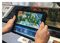
洗足軒の模型にかざす