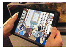
物語がはじまるよ