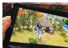
あれ？誰かあらわれた！