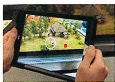
ピンを読み込むと