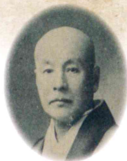
川村清雄 (木村駿吉「川村清雄 作品と其人物」1926年、国立国会図書館蔵 より)

2023年新春を皮切りに、2024年3月まで全4回にわたり開催する海舟生誕200年記念特別展では、ご要望が多かった「家族から見た勝海舟」という新たな切り口で、その生涯を紐解きます。現在、皆さまからいただいたご寄附を活用し、特別展で初御披露目する資料の修復等を進めています。その中には、海舟と懇意だった明治の洋画家・川村清雄の手による海舟の家族たちの油絵も…。乞う、ご期待!