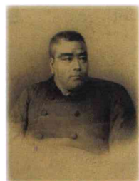
西郷隆盛肖像画複写