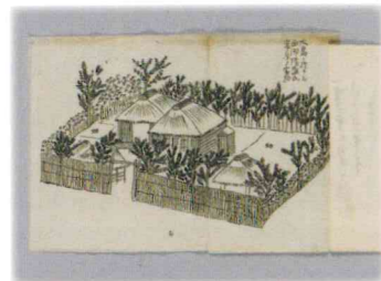
西郷隆盛奄美大島幽居の絵図

多彩な収集資料の中でも、海舟の重要な旧知である西郷隆盛の関係資料には要注目。今や原画が失われた有名な西郷隆盛肖像画(キヨッソーネ筆)の複写を前期展示で、1859～1862年にかけて西郷が隠棲した奄美大島の幽居の絵図が含まれている資料を後期展示で、それぞれ初公開します。