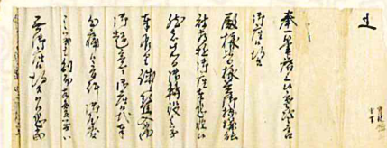
<勝海舟宛>中里謙三書状 部分(元治元年12月6日付)