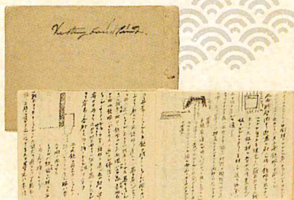
勝麟太郎ノート(安政年間)

海舟は安政2(1855)～6年、幕府の命令により長崎海軍伝習所に派遣され、算術、蒸気、造船など海軍に必要な15科目以上の教科を学びました。本展では要塞術や築城方法を記した海舟直筆のノートを初公開します。