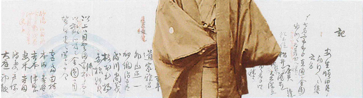
「記(水盤設置二付寄付金依頼者名簿)」