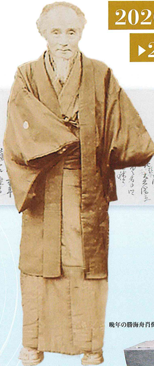
晩年の勝海舟肖像写真