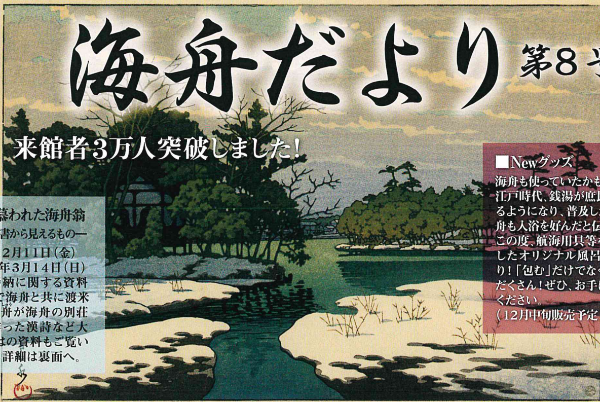
川瀬巴水「洗足池乃残雪」昭和二六年作/1951年