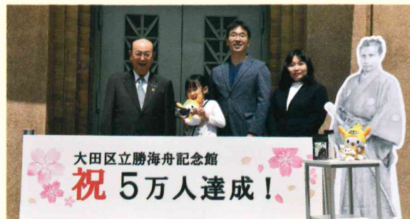
来館者5万人記念写真(勝海舟記念館にて) ※撮影時のみ一時的にマスクを外しています