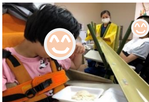
流しそうめん 夏祭りで涼を感じました☆

4、5歳の方は日帰りのみのご利用、6歳以上の方は1回のご利用で4泊5日まで、 入所が可能です。