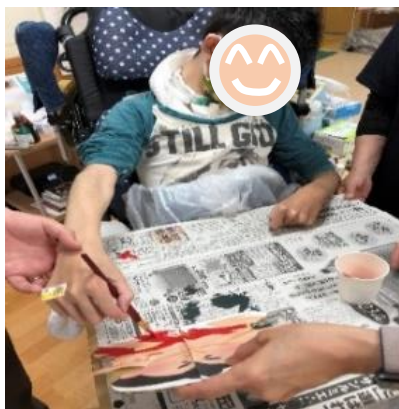
トントン相撲のカ士に色塗り

重症心身障がい児者を対象とした短期入所(ショートステイ)を行っています。 看護師の他、保育士、理学療法士による日中の療育にも力を入れています！季節に合わせたイベントや制作、運動、音楽活動などの様々な活動を行っています♪