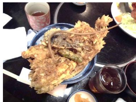
大田市場の穴子丼

活動の振り返りでは「計画どおりに実施できて、美味しい ごはんを食べられたことが楽しかった。」「時間計画や時間 管理が大変だった。」といった感想が出ました。当日、利用者 さんたちも状況確認をしながら臨機応変に対応されている ように感じましたが、「なかなか大変だった」という感想もあ りました。机上での訓練だけでは体験できなかったり、想定 が難しいことも体感されて、とても実りのある訓練になりま した。