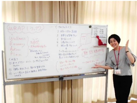
WRAPを進行するファシリテーター

こんねんど かいし ひと うえるねす りかばりー あくしょん ぶらん えいごひょうき 今年度から開始したプログラムの一つです。Wellness・Recovery・Action・Plan。その英語表記 の頭文字をとり、WRAPといいます。