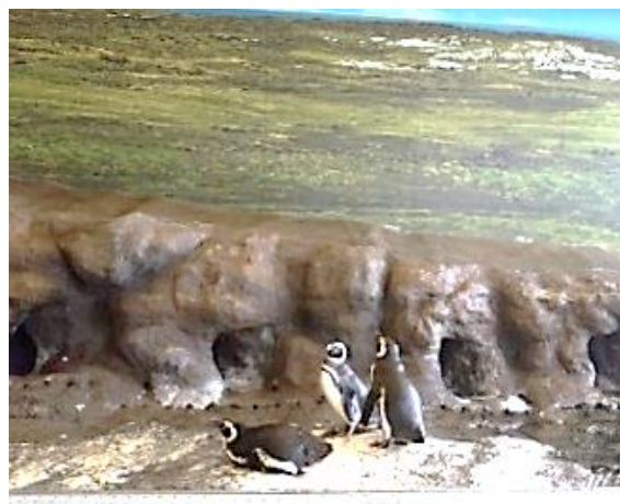
品川水族館のペンギン

7月の外出訓練で、機能訓練室では品川水族館へ、生活訓練室では大田市場と城南島アートファク トリーへ行きました。屋外での歩行練習のため、金銭感覚を養うためなど、目的は異なりますが、実 際の生活に近い状況下での訓練となります。外出訓練では目的地だけではなく、かかる費用や予定 時間といった部分まで、利用者さんが考えて実施しています。