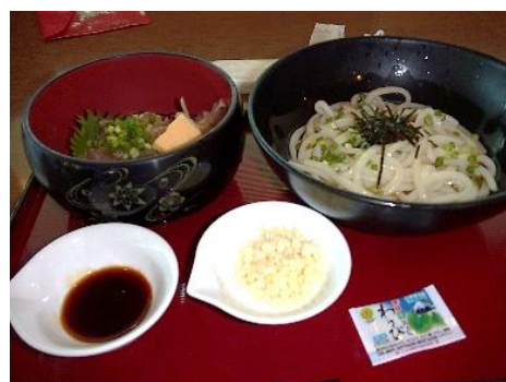
品川水族館のねぎとろ丼とうどん

がいしゅつくんれん さい 外出訓練の際、 こうひょう しょくじ 好評だった食事です