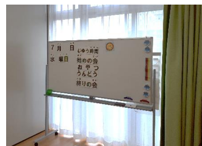
活動予定がわかるホワイトボード