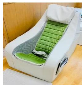
寄贈いただいたクッションチェア

寄贈いただいたクッションチェアは、心地よい光や音などの刺激で楽しんだり、リラックスしたりするスヌーズレンなどの日中活動の際や、利用者の方々がテイルームでゆったり過ごす際に活用させていただく予定です。