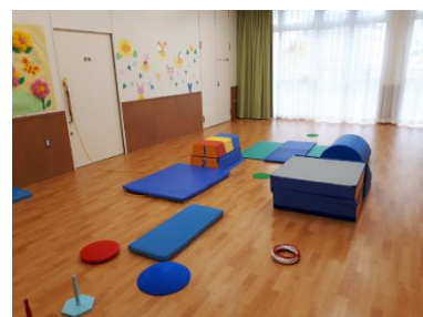
テイルームの様子

お子さんが毎日楽しく過ごせるよう、スタッフ全員で多種多様なプログラムを考え、工夫していきます。