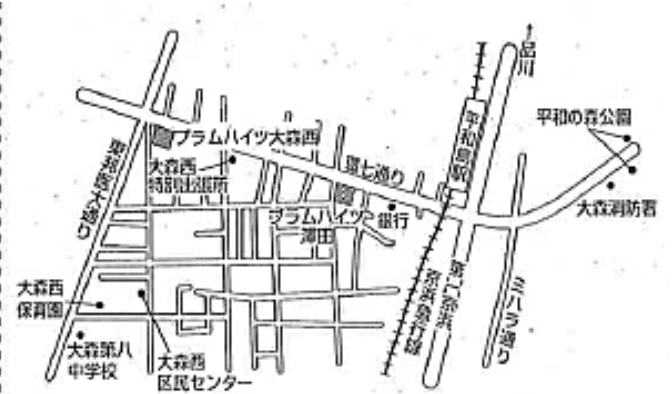
プラムハイツ大森西 (大森西2-2-1)