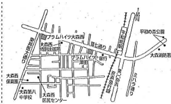
プラムハイツ大森西 (大森西2-2-1)