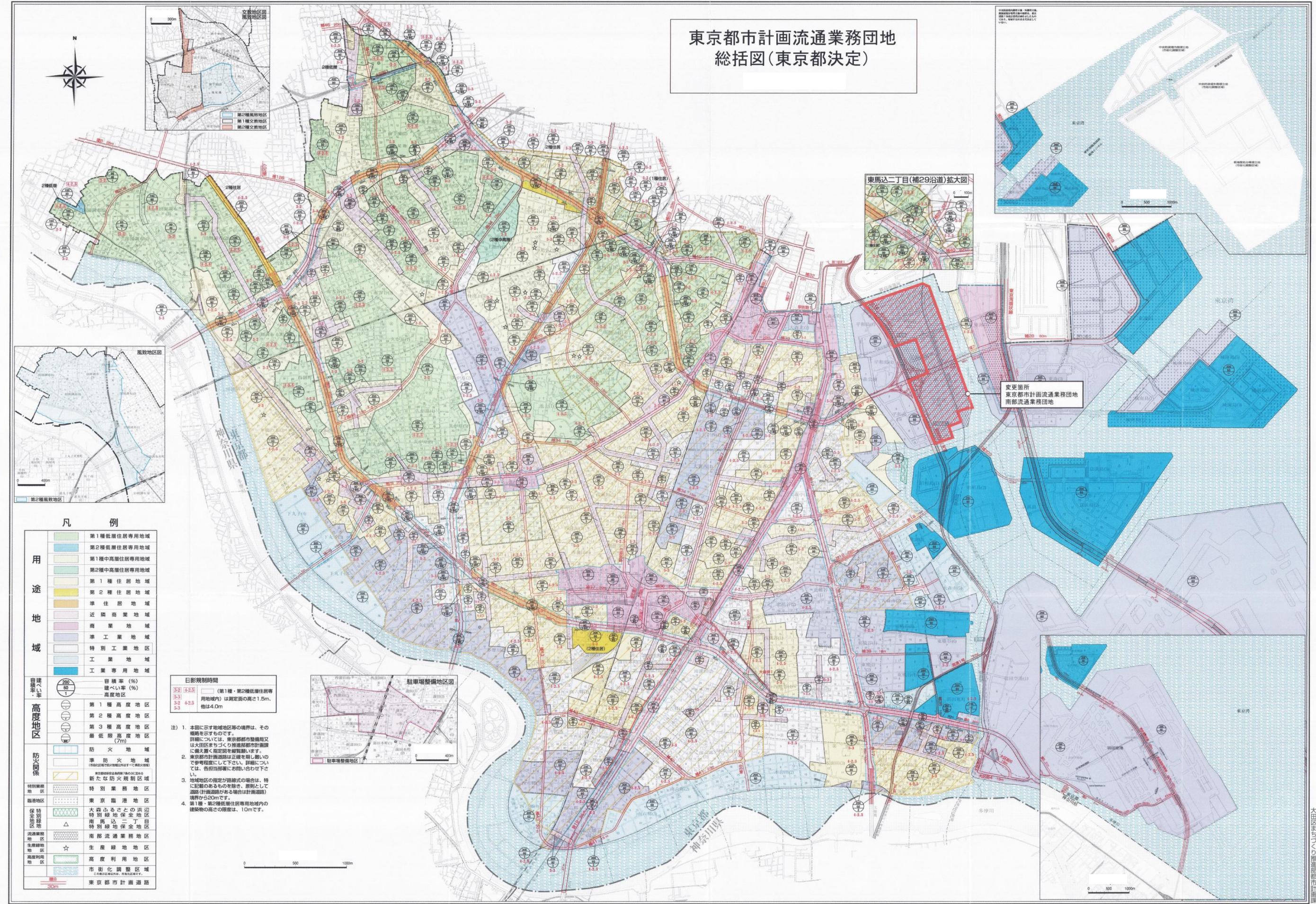
東京都市計画流通業務団地 総括図(東京都決定)