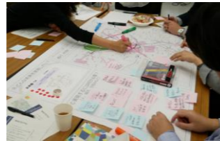
ワークショップ イメージ写真