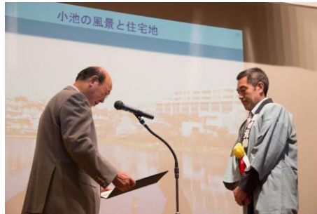
「小池の風景と住宅地」 小池若者組合