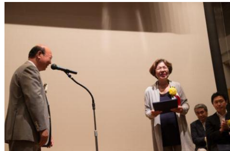
「池上6・7丁目、東矢口周辺の 花とみどりのコミュニティ活動」 なでしこの会