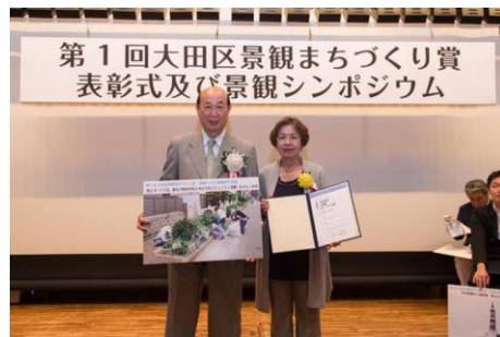
「池上6・7丁目、東矢口周辺の 花とみどりのコミュニティ活動」 なでしこの会