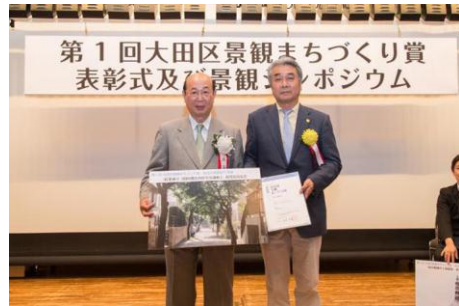
「紅葉通り（旧同潤会の住宅分譲地）」 南雪谷自治会