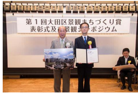
「ヤマトグループ 羽田クロノゲート」 ヤマト運輸株式会社・株式会社日建設計