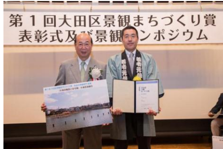
「小池の風景と住宅地」 小池若者組合