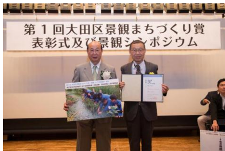
「洗足池及び周辺地区における 環境保護・育成活動」 公益社団法人洗足風致協会