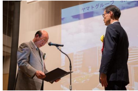
「ヤマトグループ 羽田クロノゲート」 ヤマト運輸株式会社・株式会社日建設計