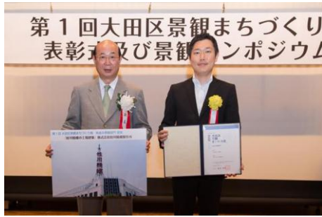
「桂川精螺の工場建築」 株式会社桂川精螺製作所