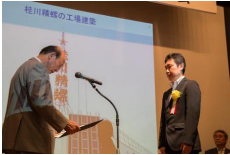
「桂川精螺の工場建築」 株式会社桂川精螺製作所