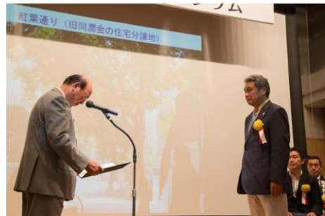
「紅葉通り (旧同潤会の住宅分譲地)」 南雪谷自治会