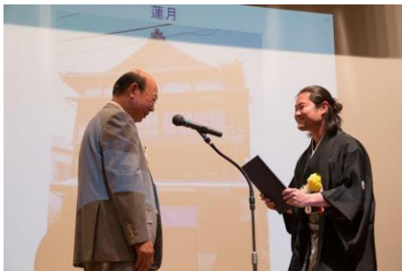
「蓮月」 株式会社蓮月