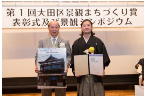
「蓮月」 株式会社蓮月