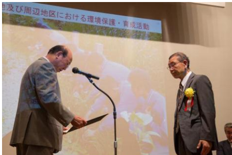
「洗足池及び周辺地区における 環境保護・育成活動」 公益社団法人洗足風致協会