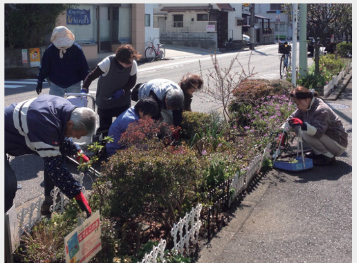
池上6・7丁目、東矢口周辺の花とみどりのコミュニティ活動 [池上6・7丁目、東矢口1・2丁目の一部]