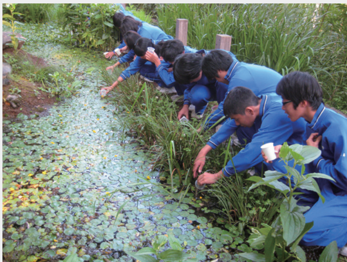
洗足池及び周辺地区における環境保護・育成活動 [洗足池とその周辺地域]

区民・団体・事業者等が取り組む、魅力的な景観形成に貢献している活動を募集しました。