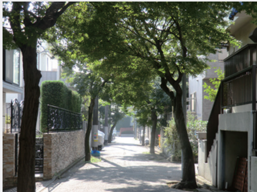
紅葉通り（旧同潤会の住宅分譲地） [南雪谷4-3・10の一部、南雪谷4-4・9]