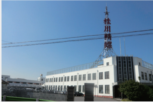
桂川精螺の工場建築 [矢口3-24-1]