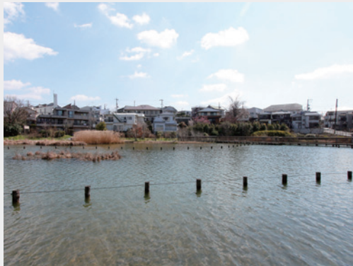
小池の風景と住宅地 [上池台1-36の周辺]