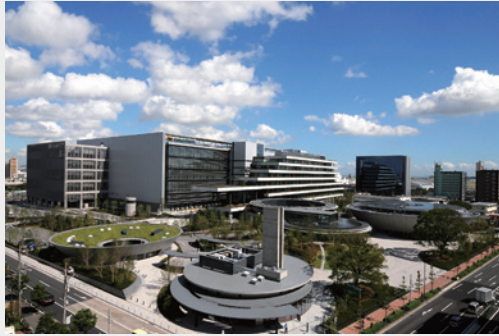
ヤマトグループ羽田クロノゲート [羽田旭町11-1]