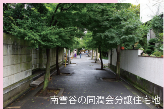
南雪谷の同潤会分譲住宅地

南雪谷4丁目には、路上の左右に紅葉が植えられた道があります。この一角は、かつて同潤会の分譲住宅地として整備された場所です。紅葉の並木はその頃の名残なんです。