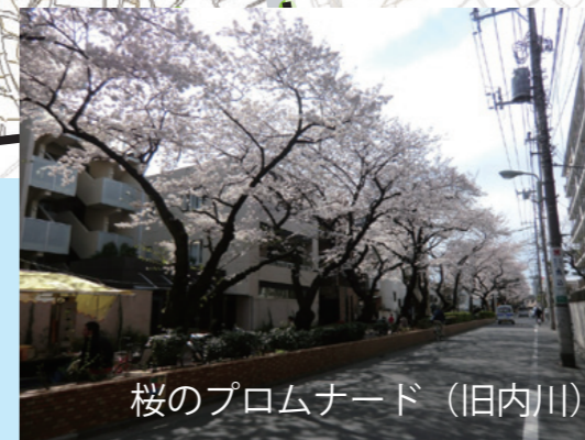
桜のプロムナード(旧内川)