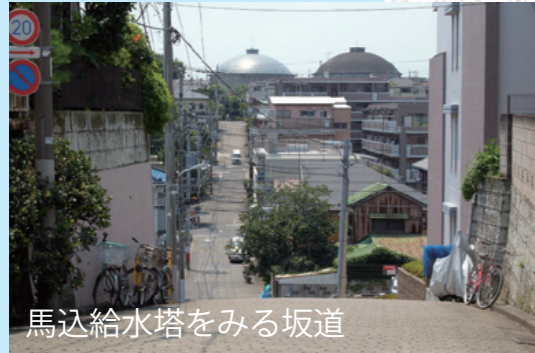
馬込給水塔をみる坂道