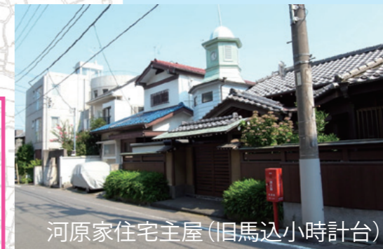
河原家住宅主屋(旧馬込時計台)