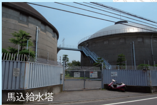
馬込給水塔 近くで見ると、かなりの迫力です!