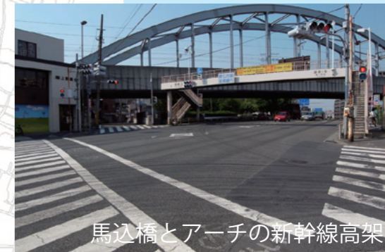
馬込橋とアーチの新幹線高架 新幹線を眺めませんか!