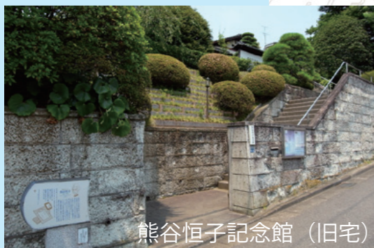
熊谷恒子記念館(旧宅)