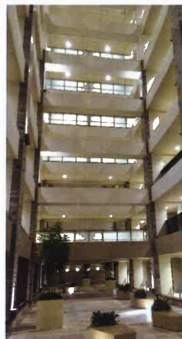
プライベートパティオ(住宅共用)