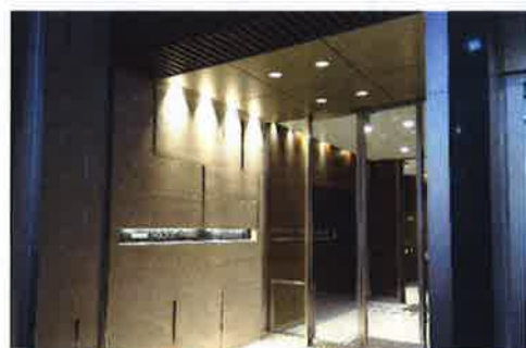
グランドエントランス(住宅共用)