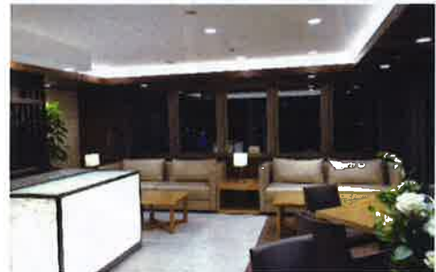
スカイラウンジ(住宅共用)