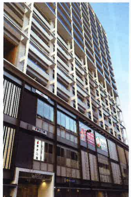
東面(補助線街路第 328 号線側)