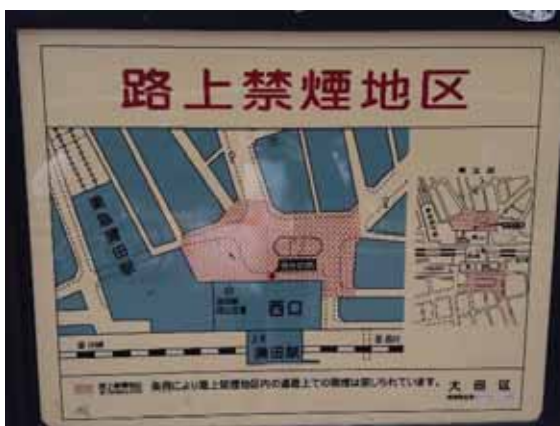
案内板6 (拠点サイン)