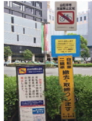
案内板2 (指示・誘導案内)