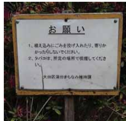
まちなみ維持へのお願い (大田区)