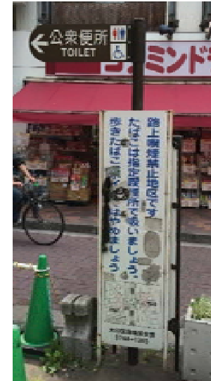
路上喫煙禁止地区の案内 (大田区)