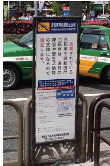
放置自転車禁止区域の案内 (大田区)