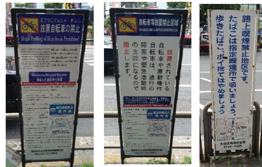
仮設 (指示・誘導の案内)