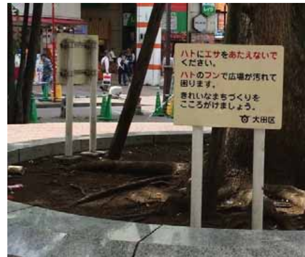
ハトのエサやり禁止の案内板 (大田区)