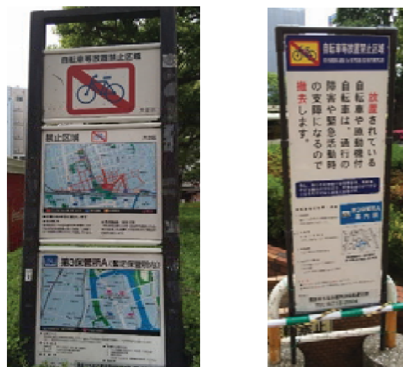
案内板4 (指示・誘導案内)