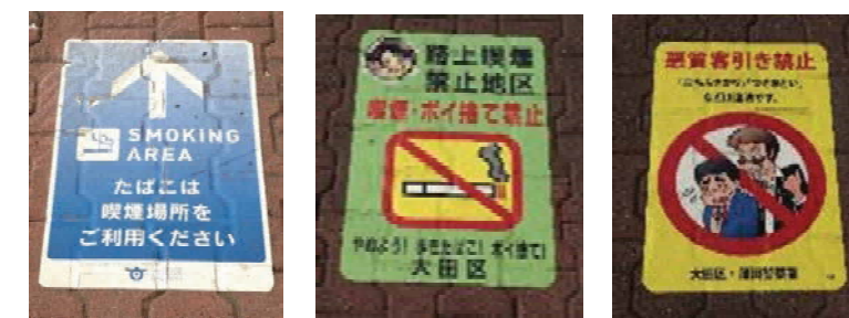
その他のサイン (路面上の表示)