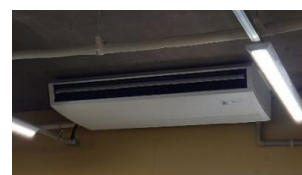
【導入した空調設備】