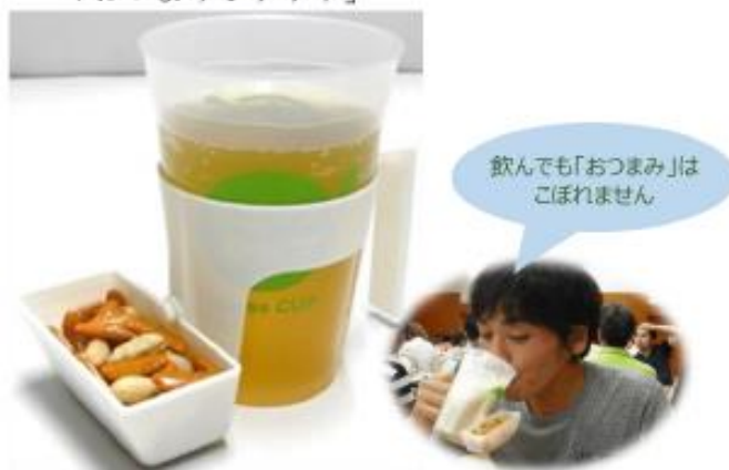
リユースカップホルダー 「おつまみポケット」