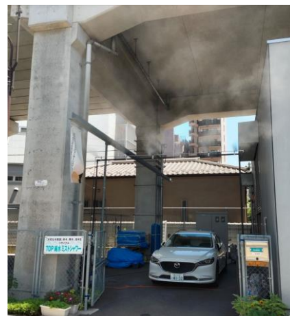
純水ミストシャワー試作品