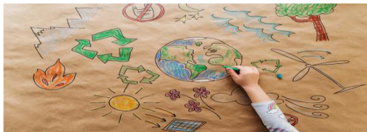
SDGs 私の取り組み 発表 企画室