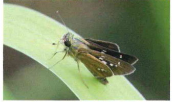
イチモンジセセリ (セセリチョウ科)

菜の花やキャベツ、ダイコン畑が街中から減る中で、家庭菜園などでかろうじて幼虫が生息している。