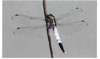
シオカラトンボ (トンボ科)

赤とんぼの仲間。翅端に褐色斑がある。オスは成熟すると全身が赤くなる。プールで見られることも多い。