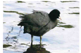
オオバン (クイナ科)

泳ぎ回るよりも、大きな足指で水際や水草の上を歩き回って、昆虫、草の芽、葉などを食べる。