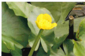
コウホネ (スイレン科)

水辺に群生してみられる。全草に特有の臭気がある。6～8月の花期に、花に近い葉の下部、半分くらいが白くなる。