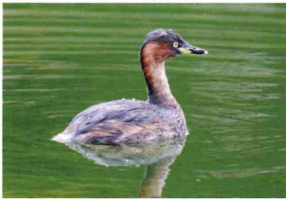
カイツブリ (カイツブリ科)

コバルトブルーの目立つ人気の鳥。洗足池などでカメラマンのレンズの先にいることが多い。