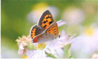
ベニシジミ (シジミチョウ科)