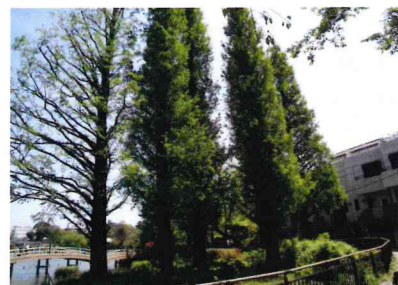
メタセコイア (スギ科)