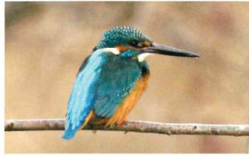
カワセミ (カワセミ科)

スズメより小さな黄緑色の鳥。その鳴き声は「長兵衛、中兵衛、中長兵衛」と聞きなされる。