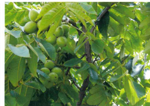
オニグルミ (クルミ科)

江戸時代末期に改良された栽培種。エドヒガンとオオシマザクラの交配種で、日本の代表的なサクラ。