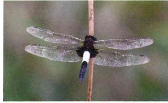
コシアキトンボ (トンボ科)

林に囲まれた小さな水路や水たまりに数匹ずつおり、多数を見かけることはない。シオカラトンボとはすみ分けて生息している。