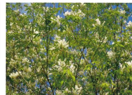
アオダモ (モクセイ科)