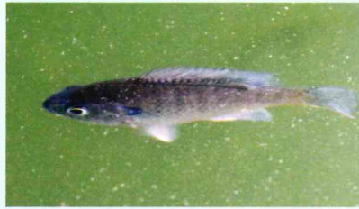
ブルーギル (サンフィッシュ科)