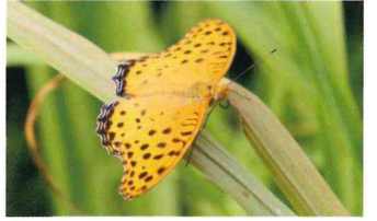
ツマグロヒヨウモン (タテハチョウ科)

翅を開くと3本の白条が横一線に並ぶ。幼虫はクスやフジなどマメ科の植物の葉を食べる。