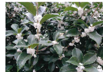
ヒイラギモクセイ (モクセイ科)