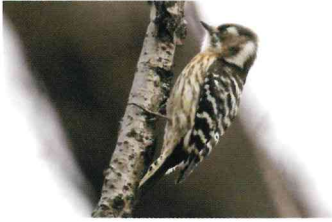
コゲラ (キツツキ科)

池のみちには、広い水面とそれを取り囲むように樹木が茂っているため、水辺の鳥や林などを好む鳥が数多くみられる。特に冬は渡り鳥の楽園になる。大自然の中とは異なって野鳥の生活圏が集中しているため、人との距離が近く、観察がしやすくなっている。