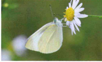
モンシロチョウ (シロチョウ科)

幼虫はサンショウやかんきつ類の葉を食べる。その姿は最初、鳥の糞に似せていて外敵から身を守っている。