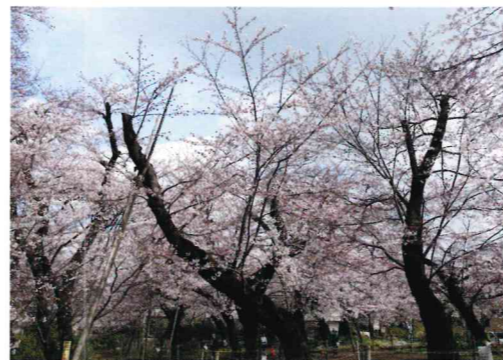
ソメイヨシノ (バラ科)

洗足池北側には通称“桜山”と“松山”と呼ばれる一画がある。桜山には100本近いソメイヨシノがあり、大田区の桜の名所となっている。松山のクロマツや水生植物園近くのハンノキの林は、美しい景観をつくるとともに、野鳥の営巣、かくれ場および移動経路として大切である。池の周囲にはコナラ林をはじめ、ムクノキ、スタジイなどがみられる。小池公園は、春の桜（ソメイヨシノ）、秋の紅葉（ミツバカエデ、メグスリノキ）のほかに、コウゾ、アオダモ、オニグルミなどがみられ、散歩の楽しみの一つとなっている。