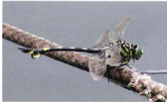
ウチワヤンマ (サナエトンボ科)

初心者にもすぐに区別できる。腹端にうちわ状の突起がある。ヤゴは深い池の底で育つ。