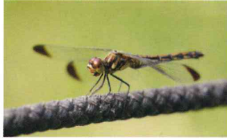
コノシメトンボ (トンボ科)

赤とんぼの仲間。翅端に褐色斑がある。オスは成熟すると全身が赤くなる。プールで見られることも多い。