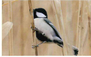
シジュウカラ (シジュウカラ科)

スズメくらいの大きさのキツツキ。公園や屋敷林で見られる。「ギィー」と鳴く白黒の小さな鳥。