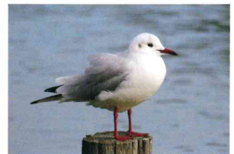
ユリカモメ (カモメ科)