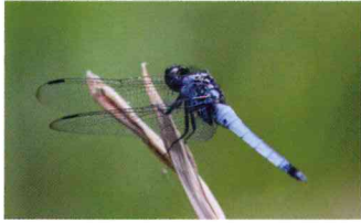
オオシオカラトンボ (トンボ科)

公園内の樹林を丹念に観察してみると、そこには昆虫など小さな命の世界が垣間見られる。特に散策路にそって植栽されている花にはチョウが舞い、水辺では多くのトンボを観察することができる。