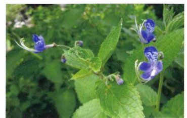
カリガネソウ (クマツヅラ科)

和名の由来は、花の様子を雁の首に見立てたもので、8～9月に青紫色の花が咲く。全草に強い臭気がある。