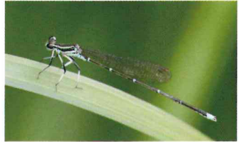
モノサシトンボ (モノサシトンボ科)

初心者にもすぐに区別できる。腹端にうちわ状の突起がある。ヤゴは深い池の底で育つ。