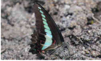
アオスジアゲハ (アゲハチョウ科)

敏捷に飛び、翅の水色のラインが目立つ。夏にはヤブガラシの花によく集まる。幼虫はクスノキやタブノキの葉を食べる。