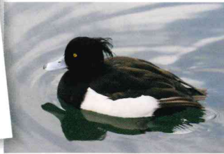
キンクロハジロ (カモ科)

冬鳥。夕暮れにねぐらから飛び立って採食場に行き、潜水して甲殻類や水草、海草などを食べる。