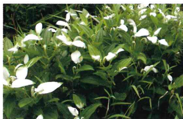
ハンゲショウ (ドクダミ科)

洗足池も小池公園も公園としての整備がされているため、四季を通じて花を楽しむことができる。春、ソメイヨシノの開花でにぎわったあとも、シランの赤紫色（4～5月）、スイレンのピンク（5～8月）、ツブキの黄色（10～12月）など色とりどりの花を楽しむことができる。