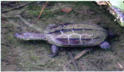
クサガメ (イシガメ科)

他のカメと異なり、甲羅表面は角質化していないので柔らかい。噛みつく力が強いので注意が必要。