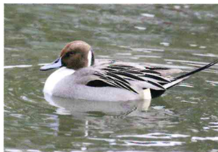
オナガガモ (カモ科)