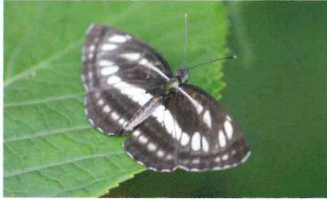
コムスジ (タテハチョウ科)

後翅に赤い斑紋列がある。中国から持ち込まれたもので、関東地方に広がっている。要注意外来生物。