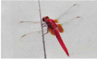
ショウジョウトンボ (トンボ科)