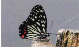
アカボシゴマダラ (タテハチョウ科)

後翅に赤い斑紋列がある。中国から持ち込まれたもので、関東地方に広がっている。要注意外来生物。