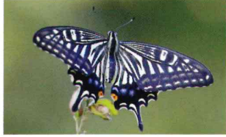
ナミアゲハ (アゲハチョウ科)

敏捷に飛び、翅の水色のラインが目立つ。夏にはヤブガラシの花によく集まる。幼虫はクスノキやタブノキの葉を食べる。