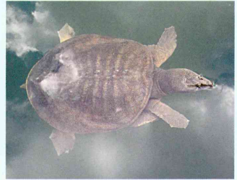
ニホンスッポン (スッポン科)

他のカメと異なり、甲羅表面は角質化していないので柔らかい。噛みつく力が強いので注意が必要。