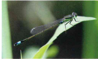
アオモンイトトンボ (イトトンボ科)