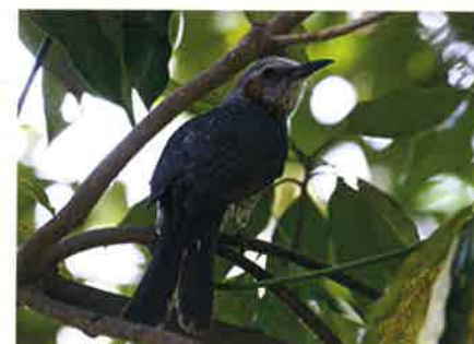
ヒヨドリ (ヒヨドリ科)