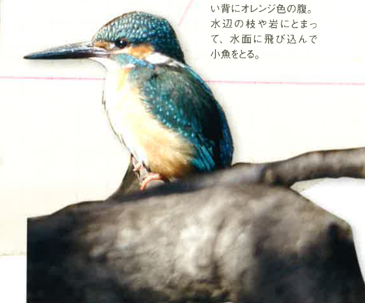
カワセミ (カワセミ科)

スズメくらの大きさ。青い背にオレンジ色の腹。水辺の枝や岩にとまって、水面に飛び込んで小魚をとる。