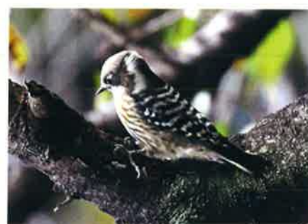
コゲラ (キツツキ科)

緑色のキツツキで、頭に赤い模様。日本の特産種。「雑木林のみち」では、ほかにスズメくらの大きさで体に白と黒の横じまがあるコゲラもみられる。