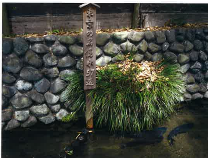
東京の名湧水57選(六郷用水)。

台地が侵食され、地下水面が露出する場所には湧水が存在する。この地域の台地には10メートル以上におよぶ関東ローム層と、その下部に砂層・砂礫層があり、これが地下水層になっている。湧水は地域の水循環や小川・池の生態系にとって重要である。六郷用水に沿う崖線や田園調布せせらぎ公園の谷頭部には現在も多くの湧水がみられるが、地下水の源になる台地上の降水の浸透が少なくなると、湧水量は減少傾向にある。