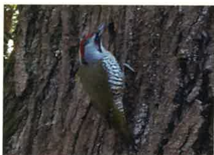
アオゲラ (キツツキ科)

ドバトより少し小型。全体に薄い茶色で、翼にはウロコ模様がある。首には青い斑点がある。「デ、デッ、ポッポー」とくりかえし鳴く。