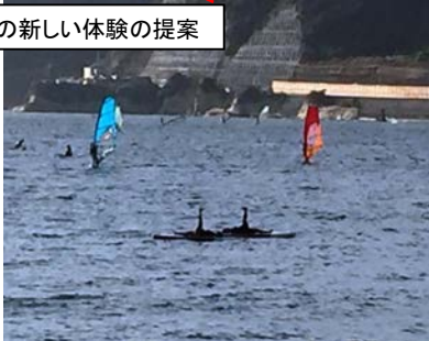
水面活用イメージ