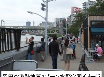
羽田空港跡地第1ゾーン水際空間イメージ