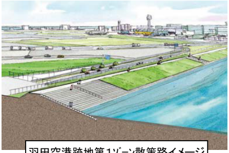
羽田空港跡地第1ゾーン散策路イメージ