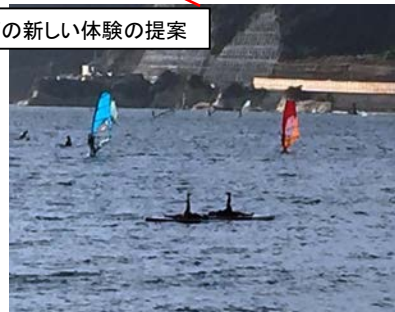
水面活用イメージ