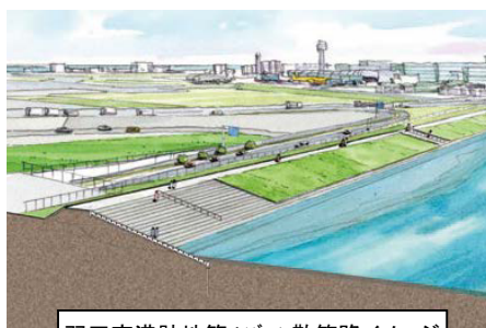
羽田空港跡地第1ゾーン散策路イメージ