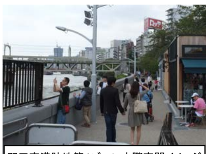
羽田空港跡地第1ゾーン水際空間イメージ