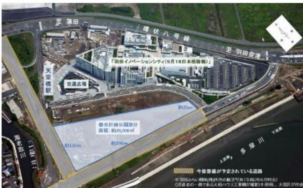
現地航空写真(令和2年6月時点)

多くの方にご利用いただける公園を整備・運営していくために、ご利用になる皆さまのご意見を踏まえたうえで、公園の基本的な考え方をまとめていくことを考えております。そこで、「こんな公園に行ってみよう」「こんな施設が欲しい」「こんなことをしてみよう」など、公園に関する多様なアイデアを以下のとおり募集します。たくさんのご応募、お待ちしております！！