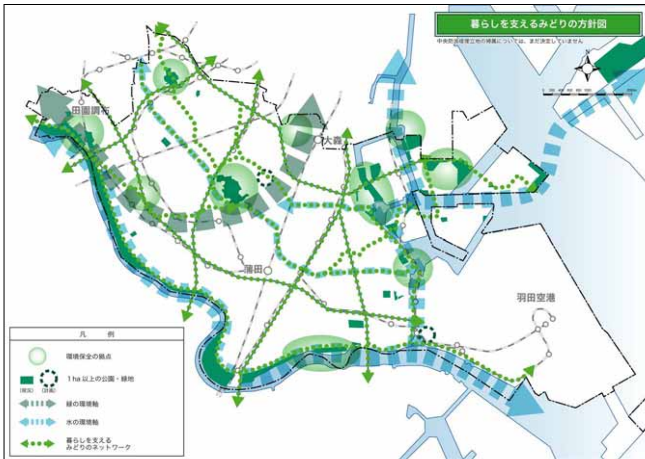
図-30 暮らしを支えるみどりの方針図