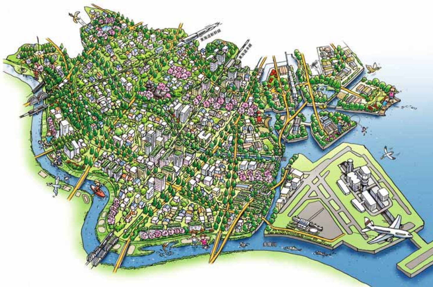
図-27 「みどり あふれる 未来 CITY おおた」のイメージ

本計画では、基本理念の趣旨に基づき、20年後のみどり豊かな潤いのあるまちのあるべき姿と して新たな将来像を設定しました。