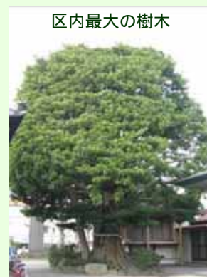
区内最大の樹木 タブノキ 直径170cm 東嶺町

春から夏は緑の木陰をつくり、秋の美しい紅葉や、季節ごとの花や実で私たちを楽しませてくれる木々。単に見た目がよく気持ち安らぐといったことにとどまらず、二酸化炭素を吸収して酸素をつくりだし、温暖化防止など地球環境の改善に大きく貢献しています。また、樹幹を大きく広げた木は強い日差しを遮り、人々の暑さを和らげ、蒸散作用によりヒートアイランド現象を緩和してくれます。木を大切に育て、増やしていきましょう!