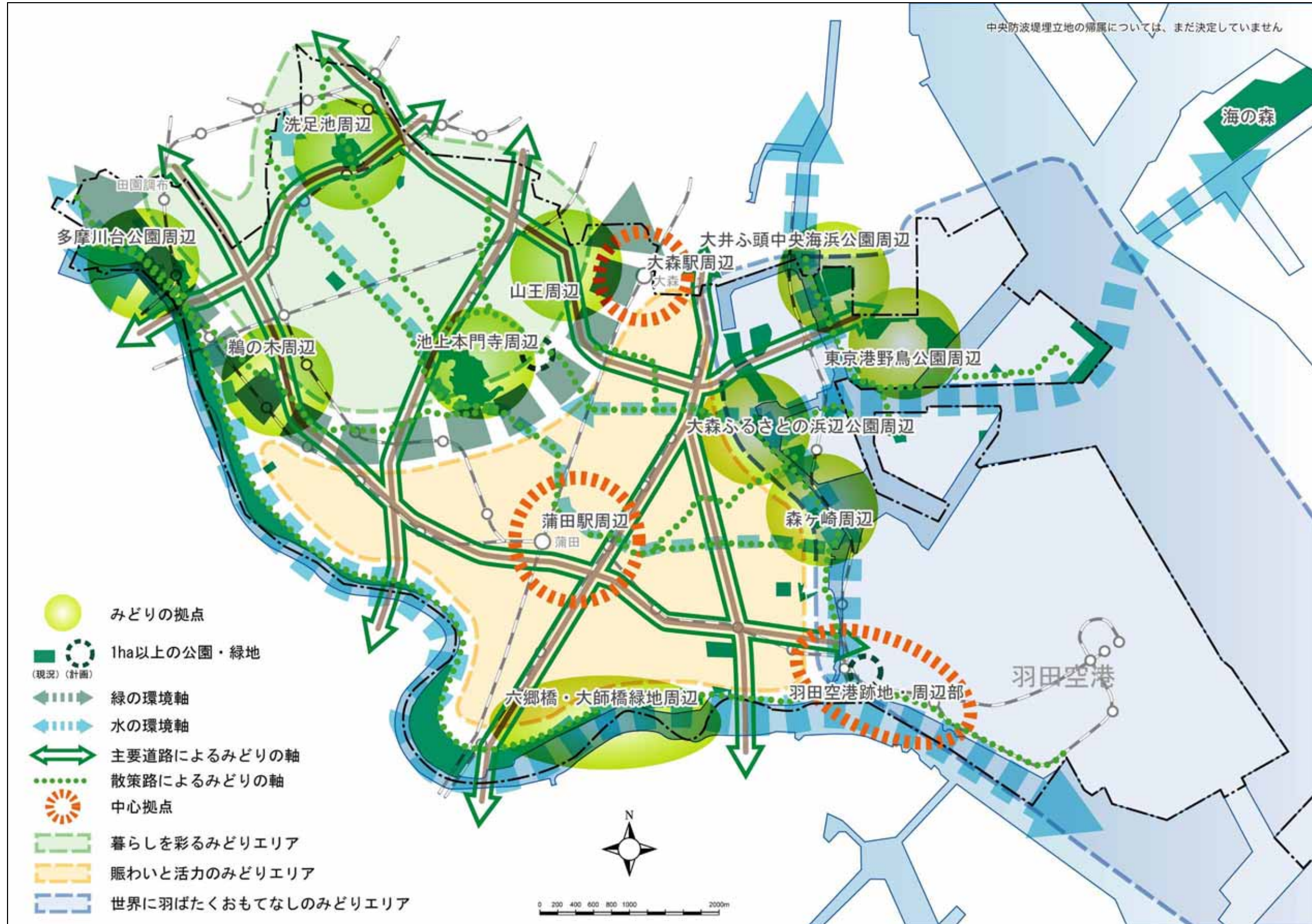
図-34 みどりの配置方針図