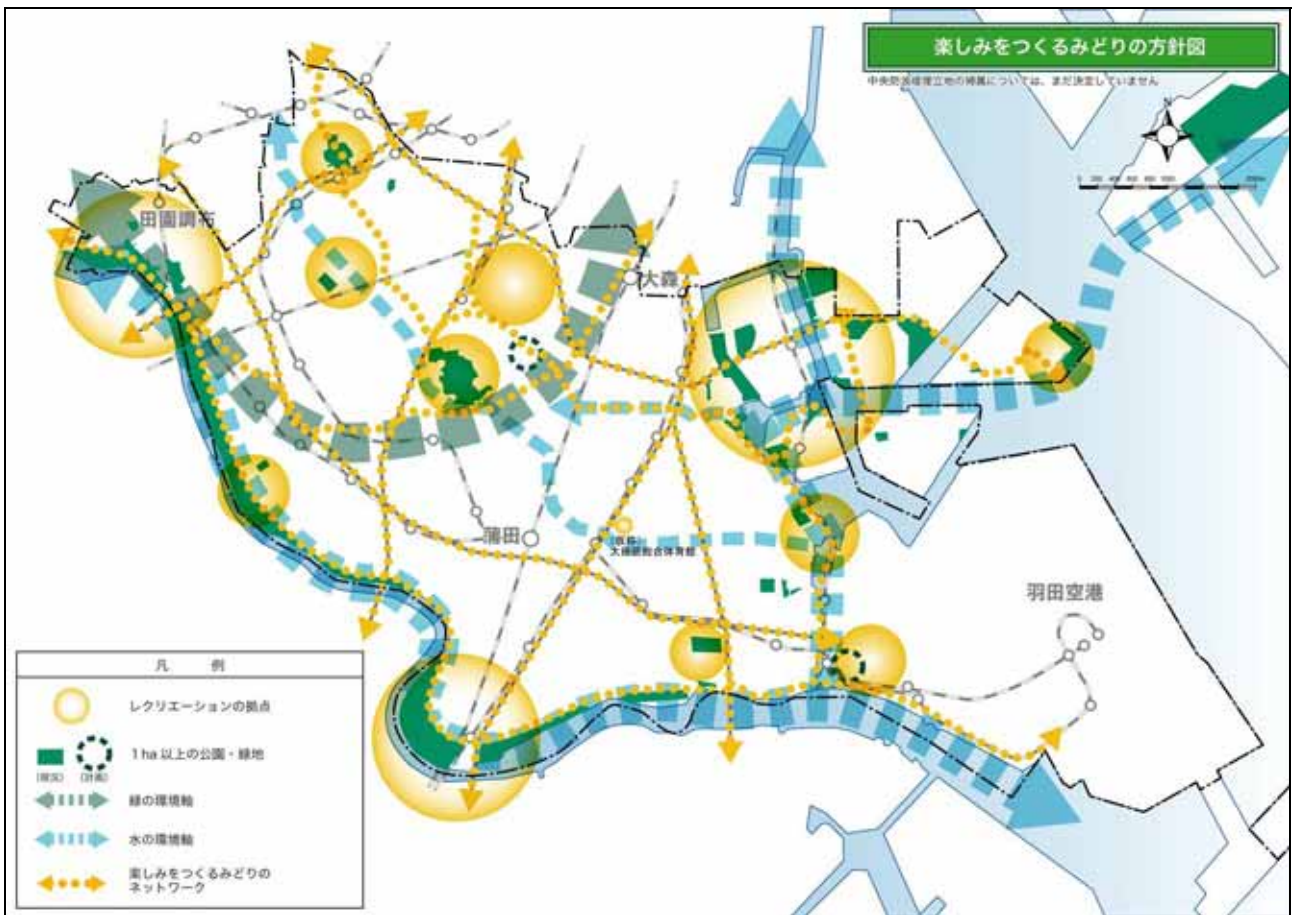
図-31 楽しみをつくるみどりの方針図

河川敷緑地や大規模公園のスポーツ・レクリエーション施設の拡充 臨海部の魅力ある賑わいを生む新たなレクリエーション拠点づくり 水辺の散策路やサイクリングロード、既存の緑道などを活用した、楽しみをつくるみどりのネットワークづくり 歴史・文化や自然を活かしたみどりの散歩道づくり (仮称)大田区総合体育館の建設 スポーツ施設の不足している地域での新たな体育館建設などの施設拡充 誰もが身近な場所で遊べ、健康づくりができ、みどりを楽しめる、まちのみどりの拠点である公園・緑地の整備