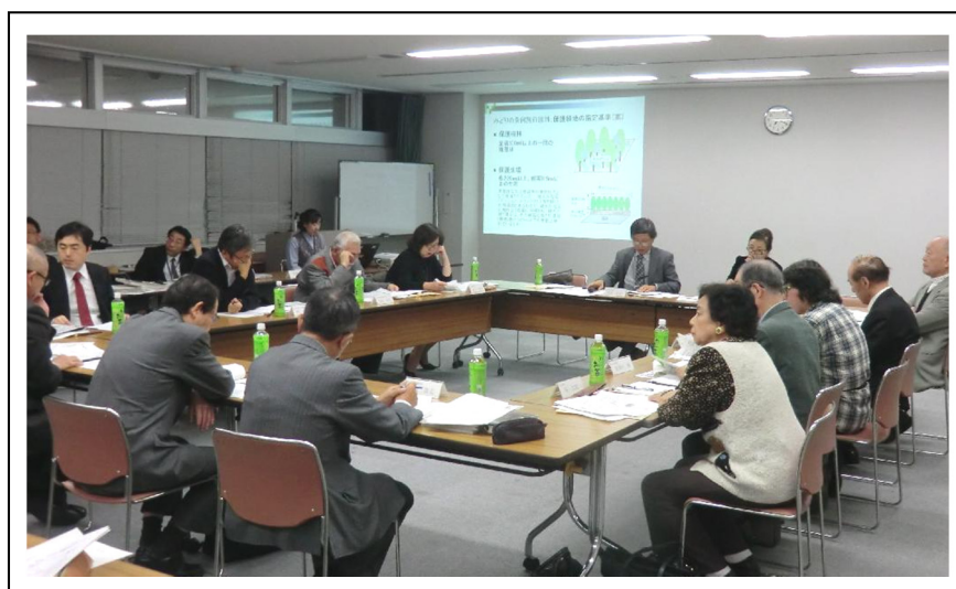
第6回グリーンプランおおた推進会議