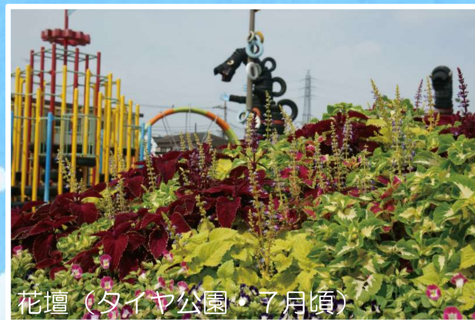
花壇 (タイヤ公園・7月頃)