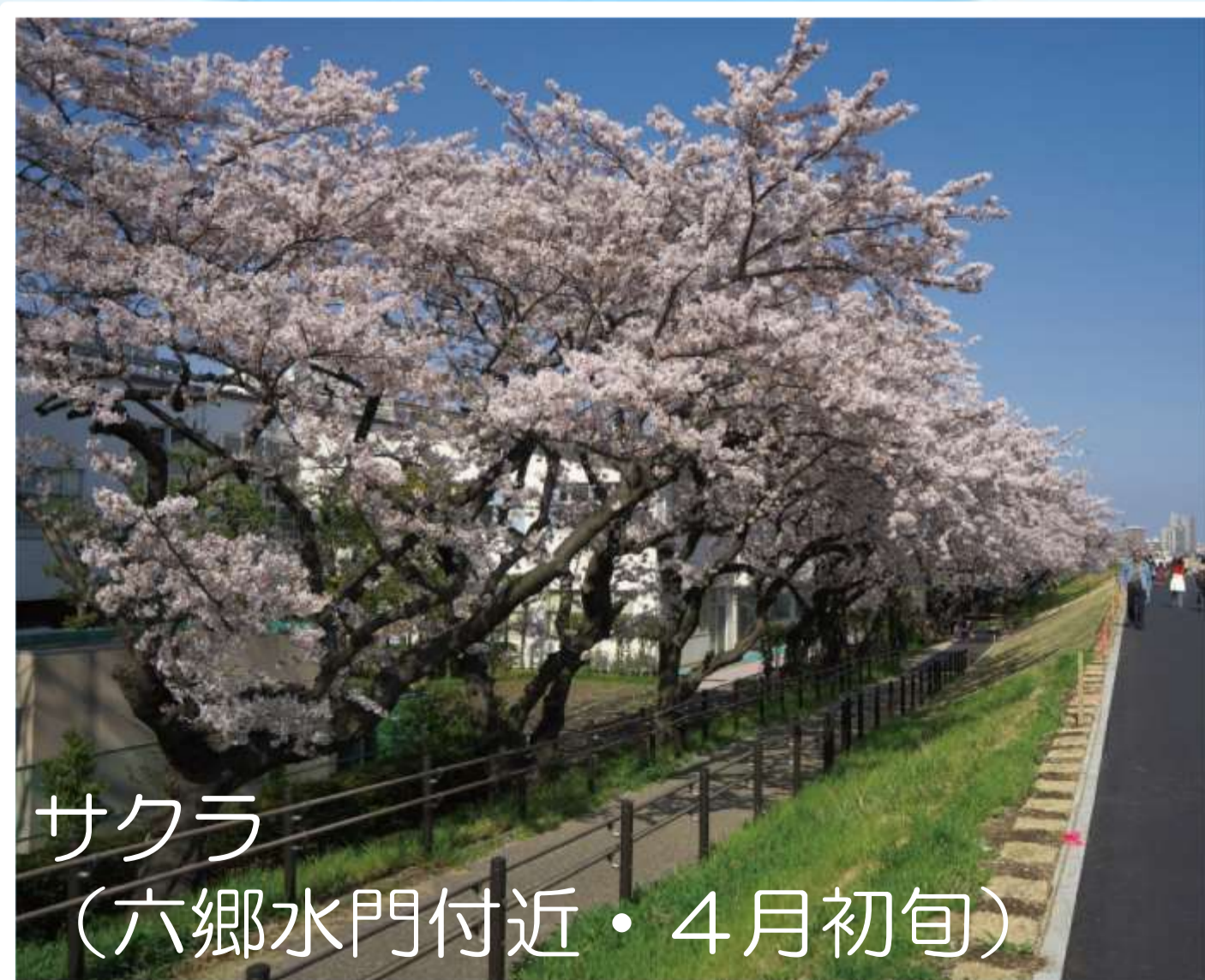
サクラ (六郷水門付近・4月初旬)