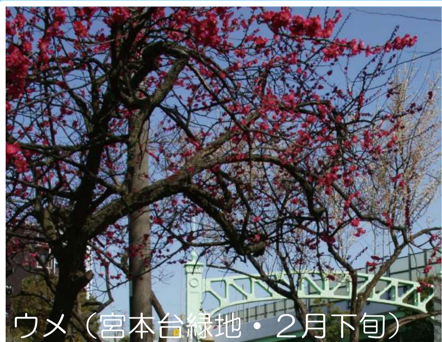
ウメ (宮本台緑地・2月下旬)