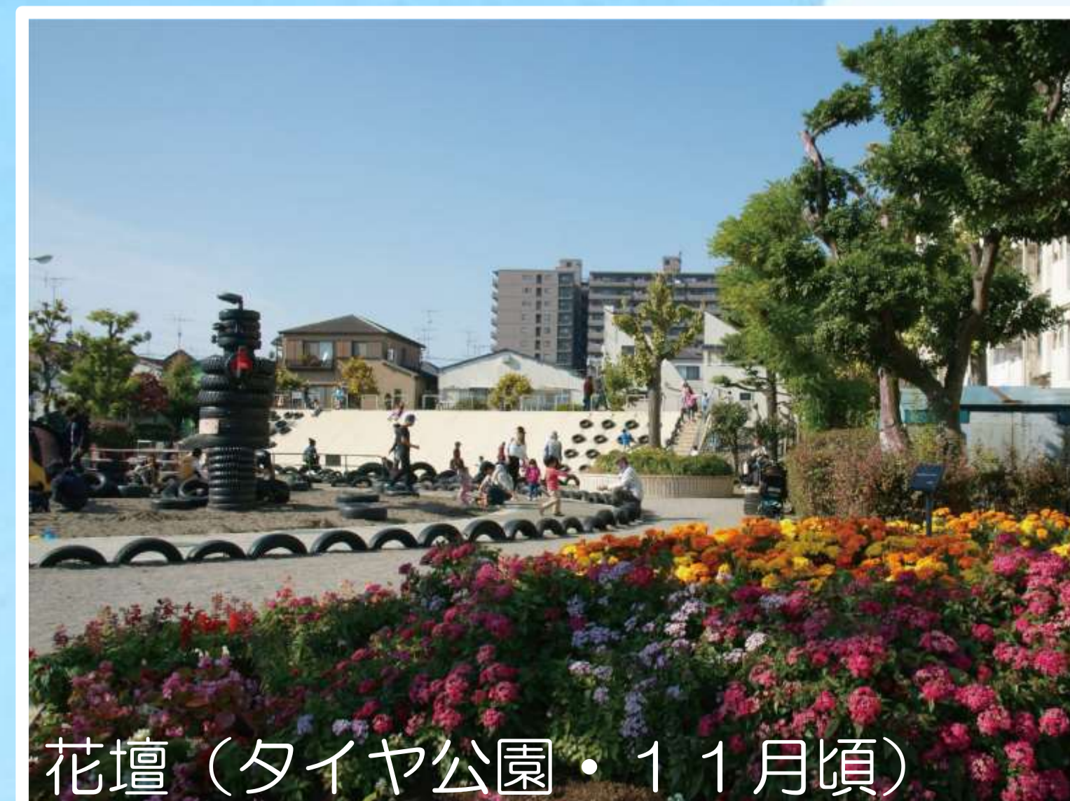
花壇 (タイヤ公園・11月頃)