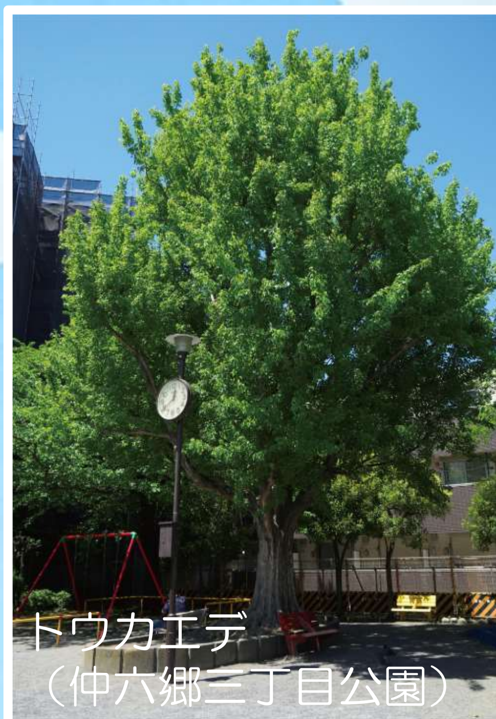
トウカエデ (仲六郷三丁目公園)