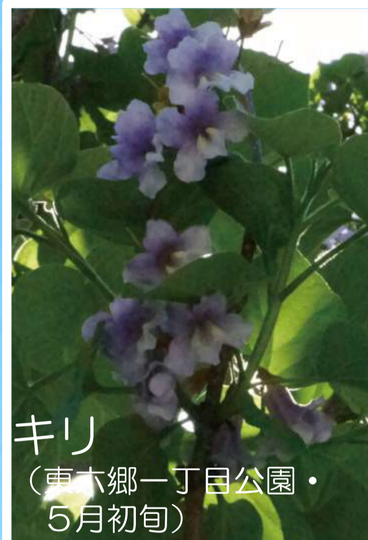
キリ (東六郷一丁目公園・5月初旬)