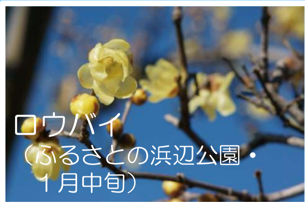
ロウバイ (ふるさとの浜辺公園・ 1月中旬)