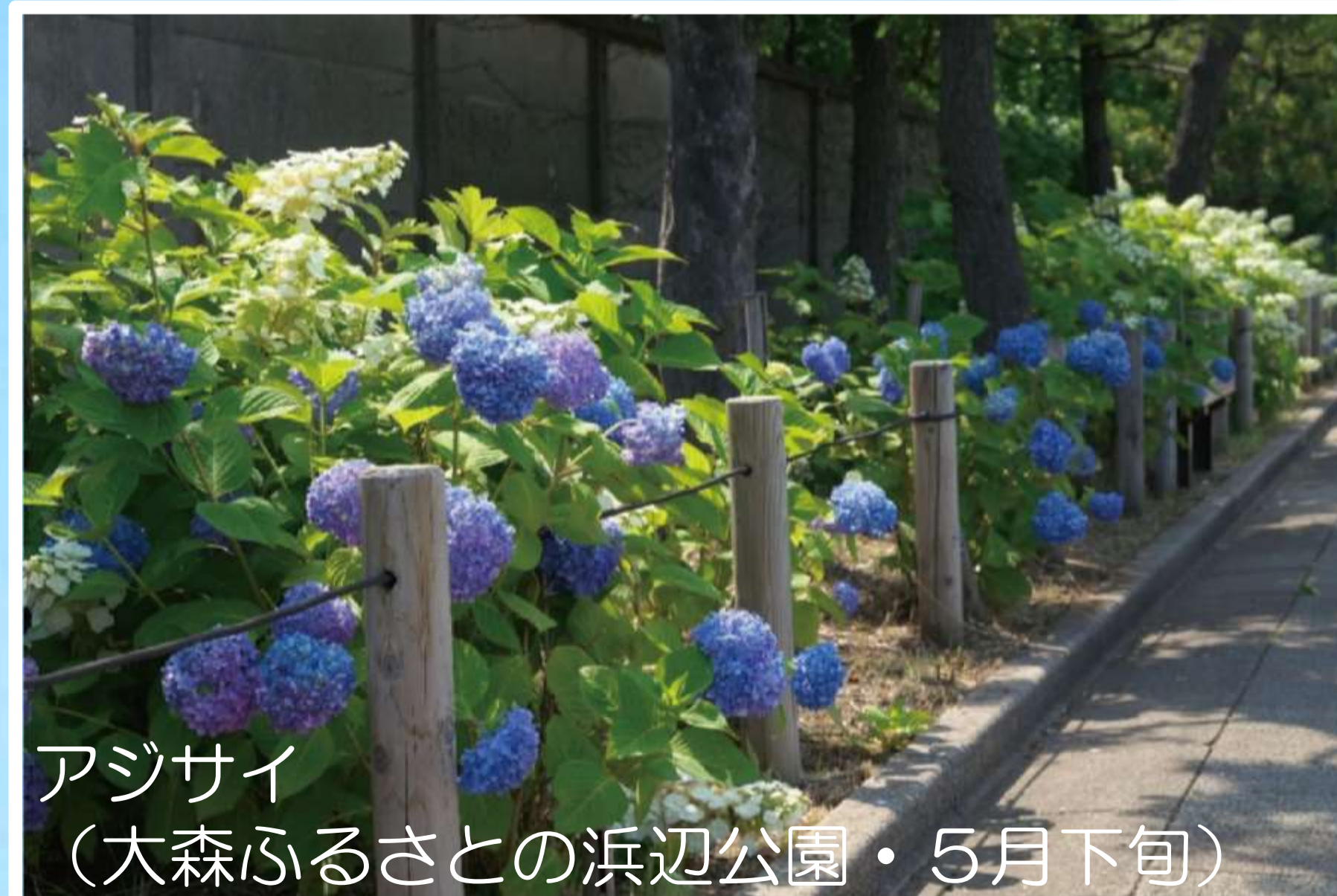
アジサイ (大森ふるさとの浜辺公園・5月下旬)