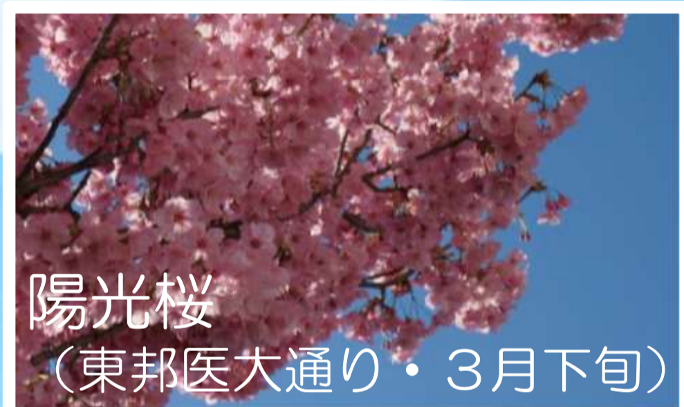
陽光桜 (東邦医大通り・3月下旬)