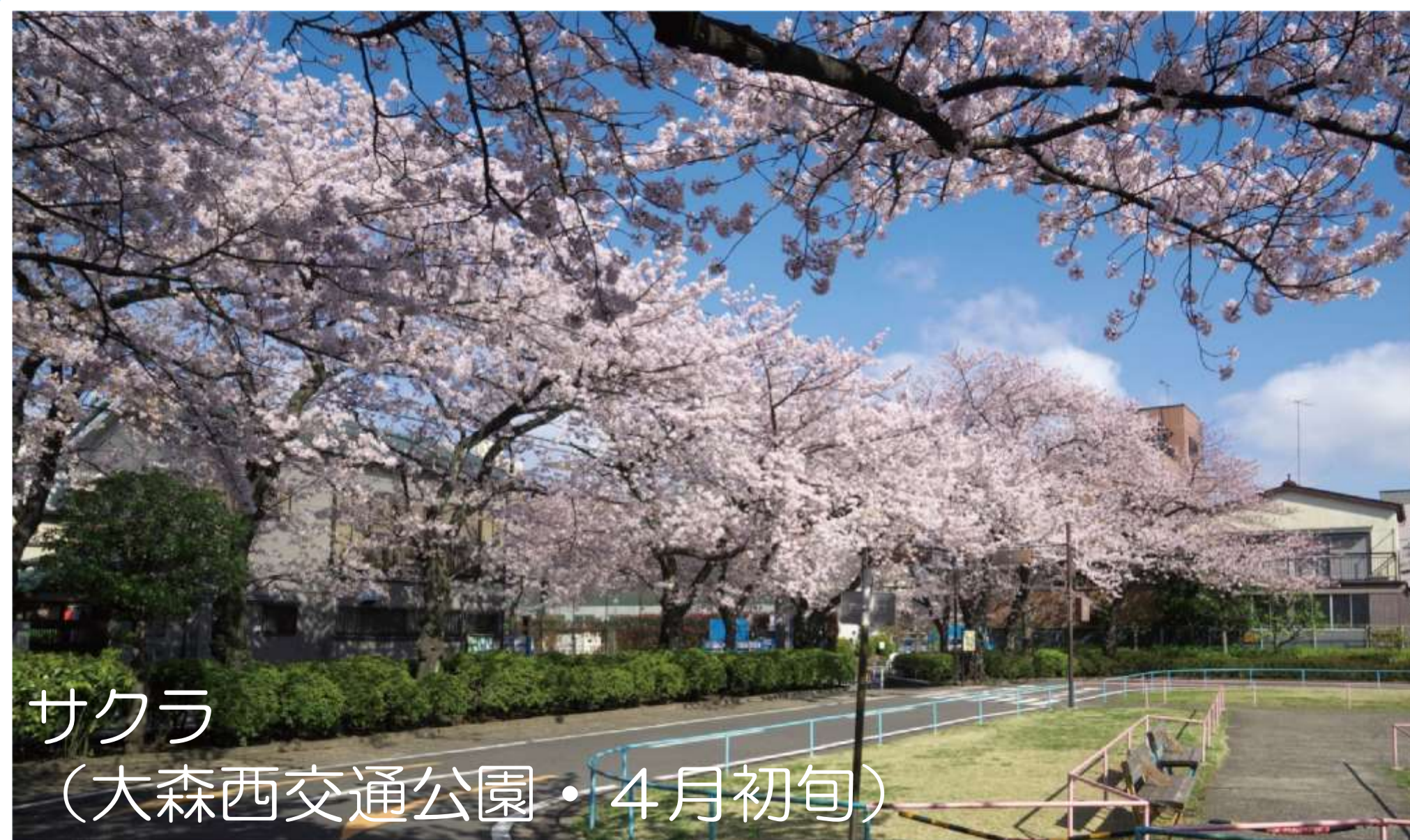
サクラ (大森西交通公園・4月初旬)