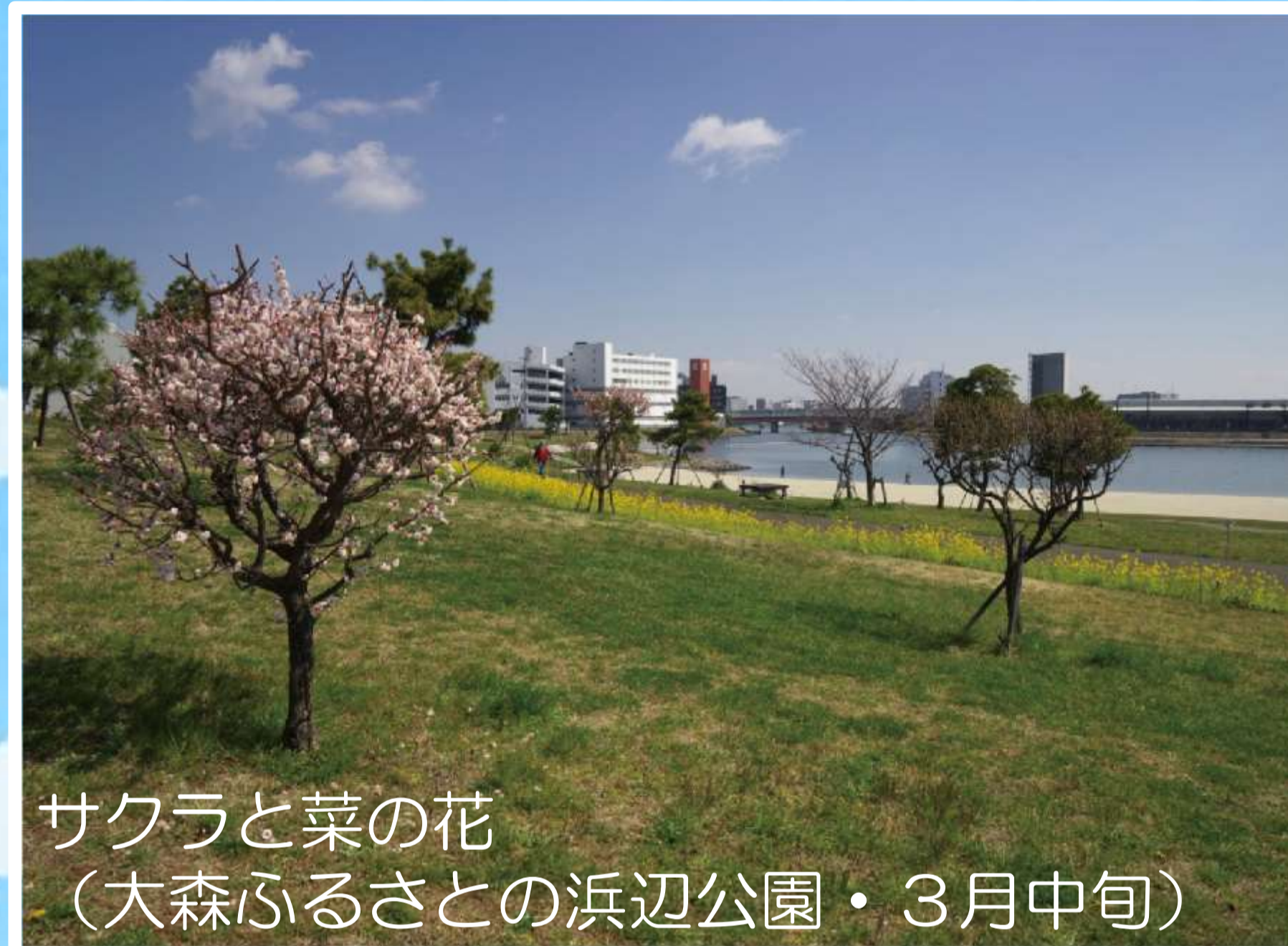
サクラと菜の花 (大森ふるさとの浜辺公園・3月中旬)