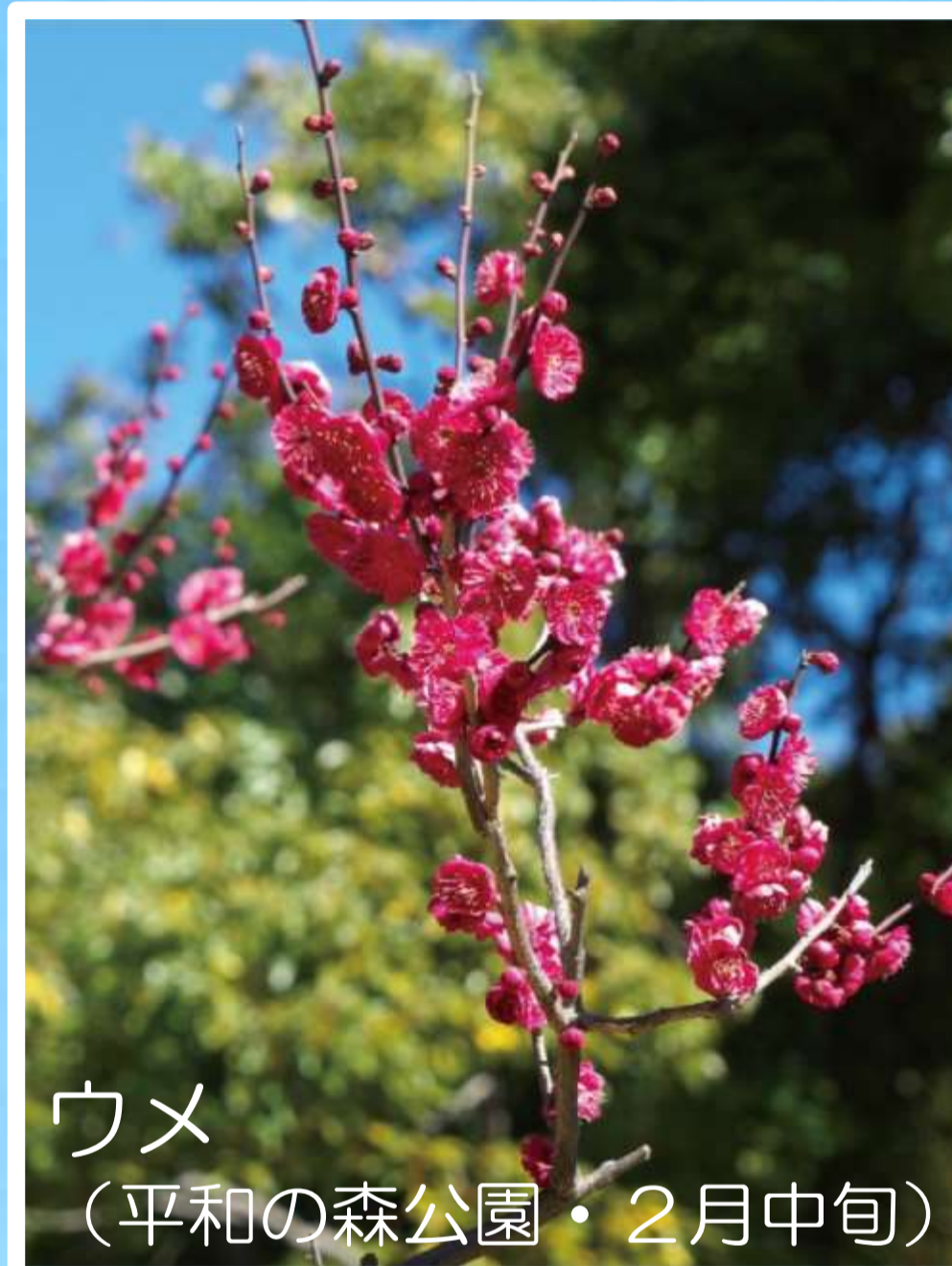
ウメ (平和の森公園・2月中旬)