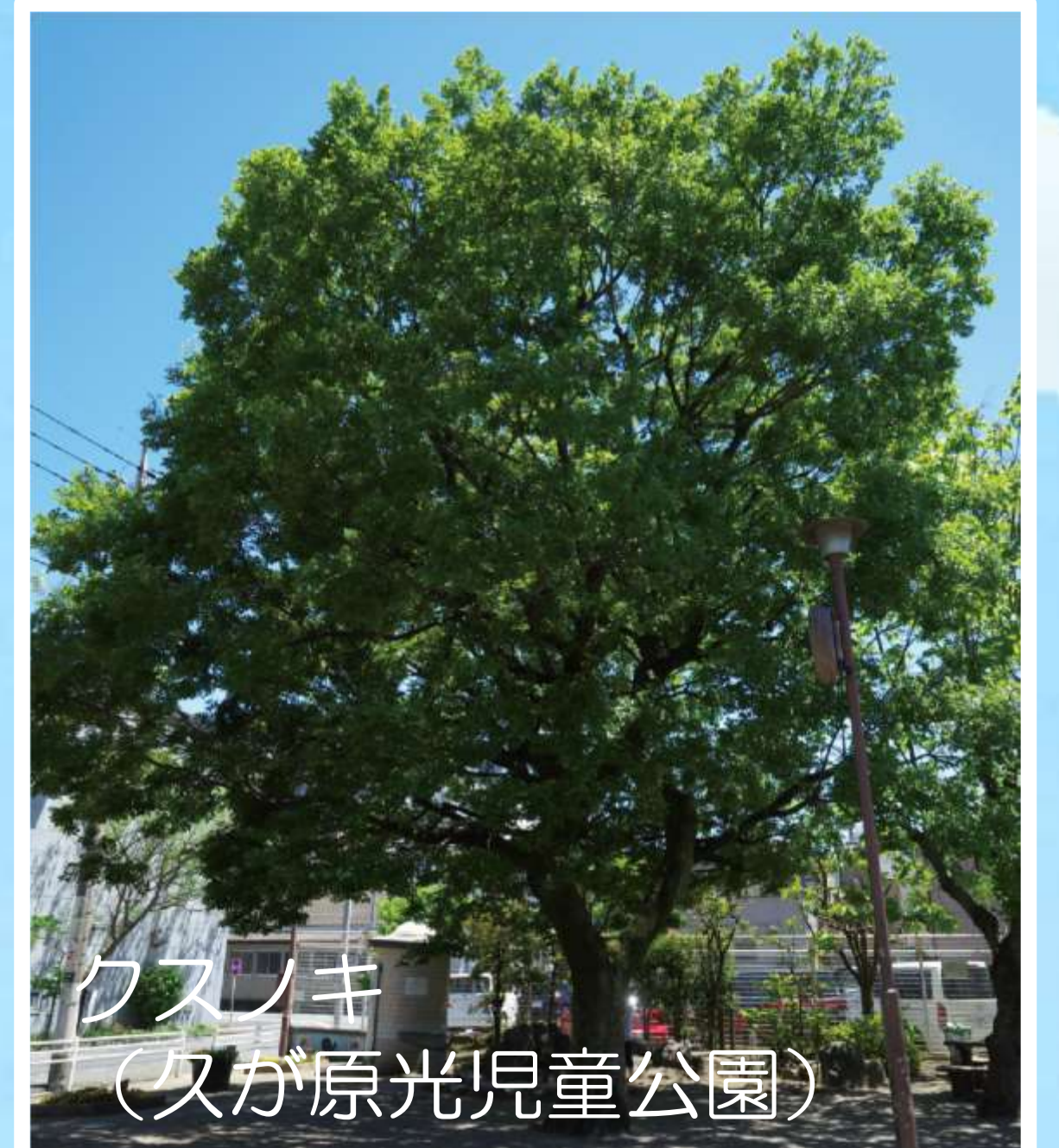
クスノキ (久が原光児童公園)