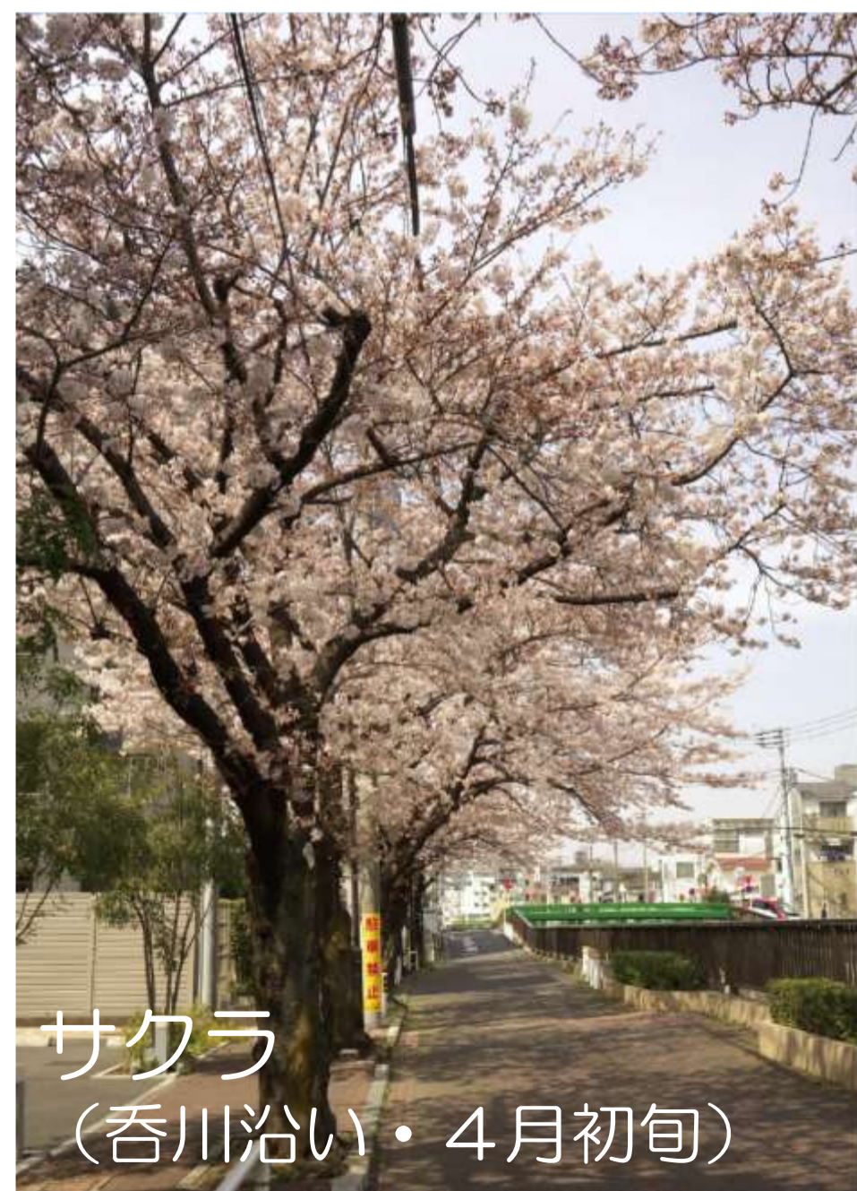
サクラ (呑川沿い・4月初旬)