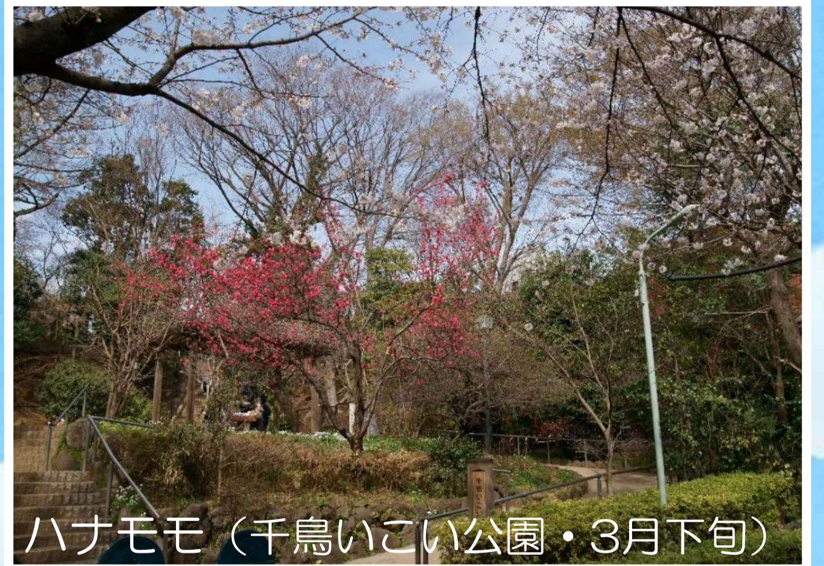
ハナモモ (千鳥いこい公園・3月下旬)