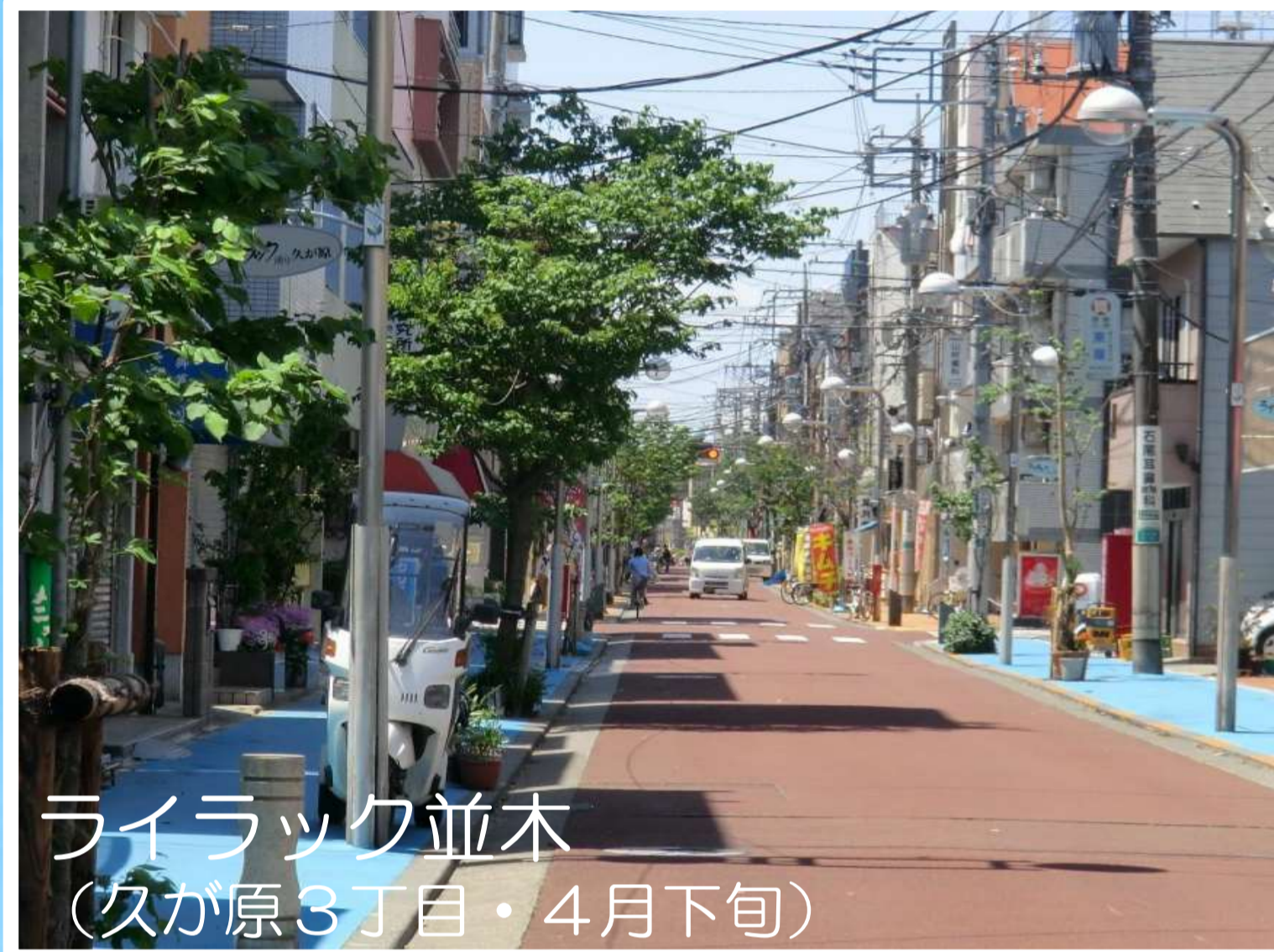
ライラック並木 (久が原3丁目・4月下旬)