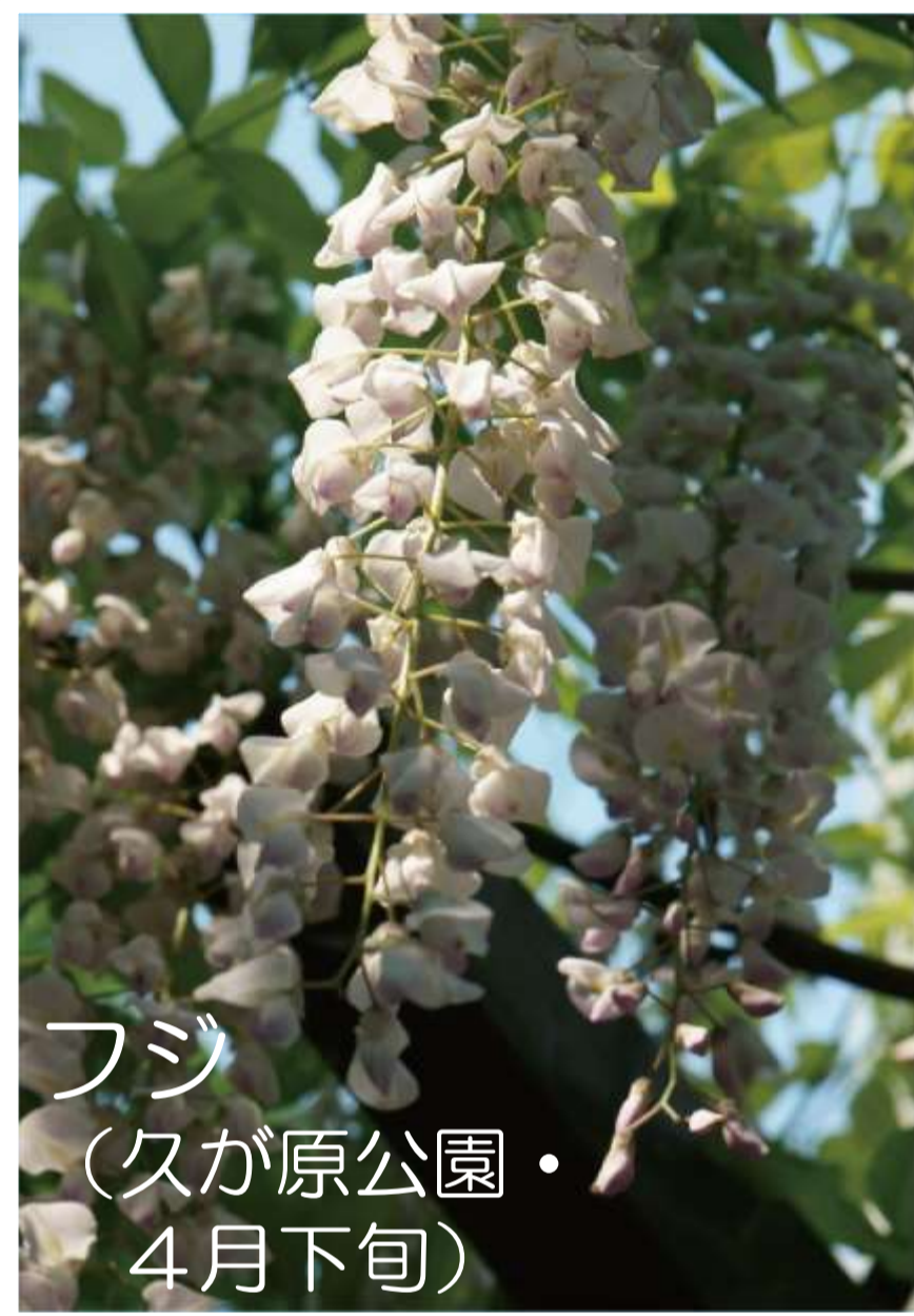
フジ (久が原公園・ 4月下旬)