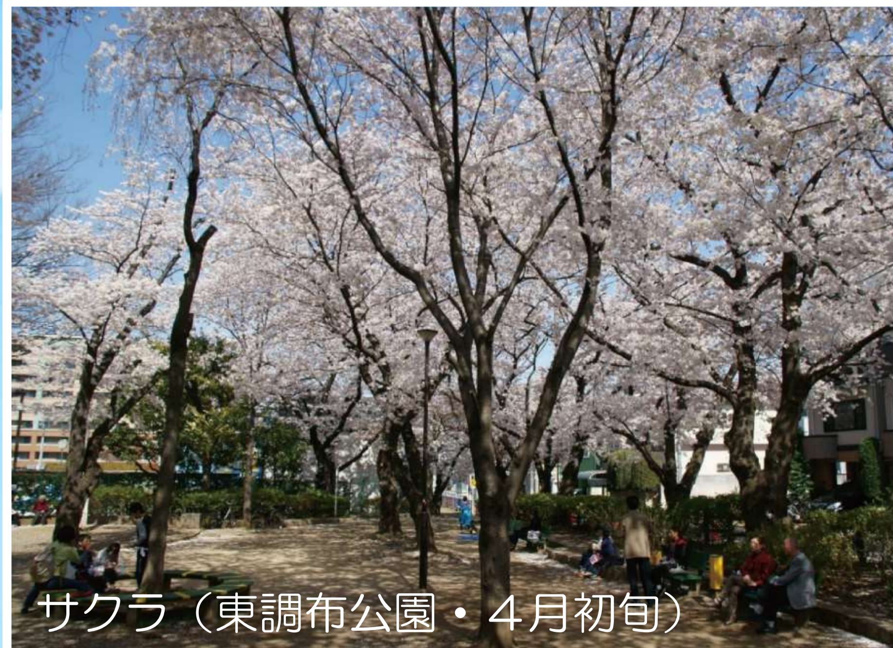
サクラ (東調布公園・4月初旬)