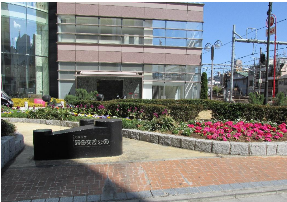
↑ 花壇 (蒲田交差公園)