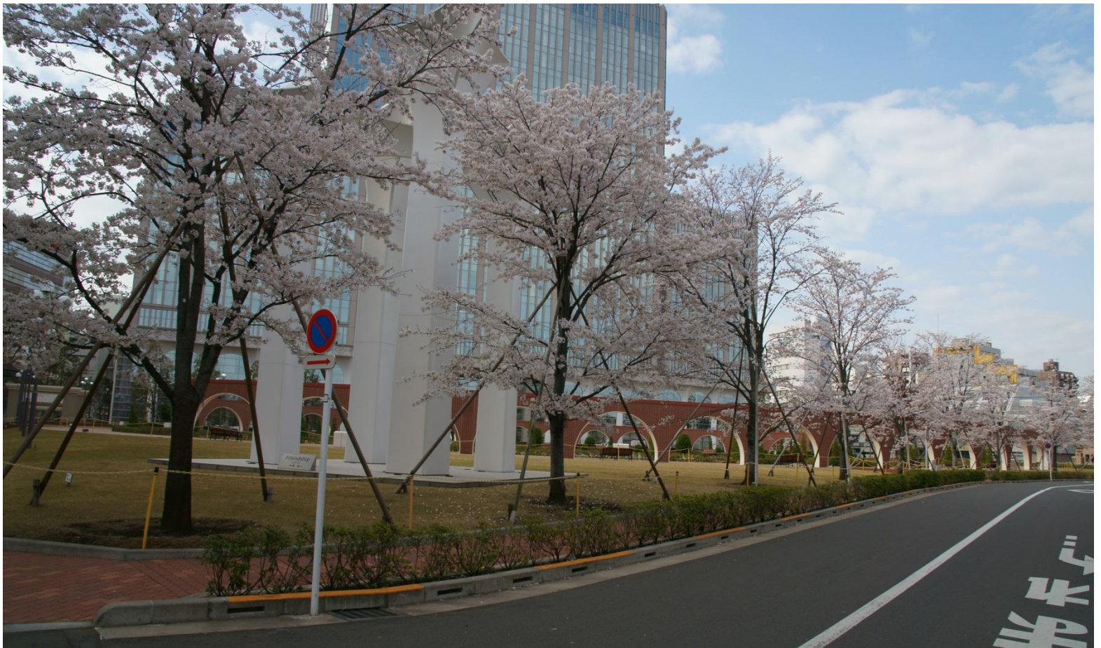
↑ サクラ(東京工科大学)