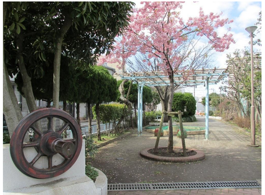
↑ 河津桜(道塚南公園)3月中旬