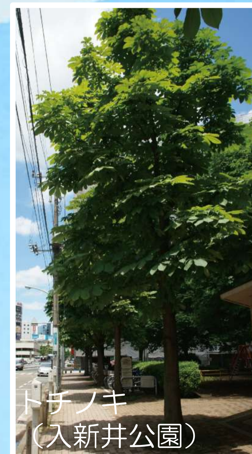
トチノキ (入新井公園)