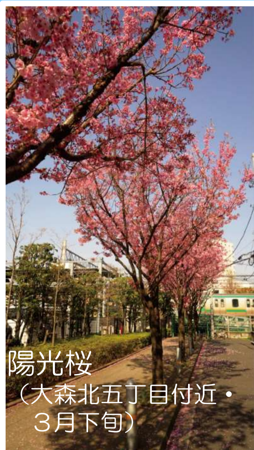
陽光桜 (大森北五丁目付近・ 3月下旬)