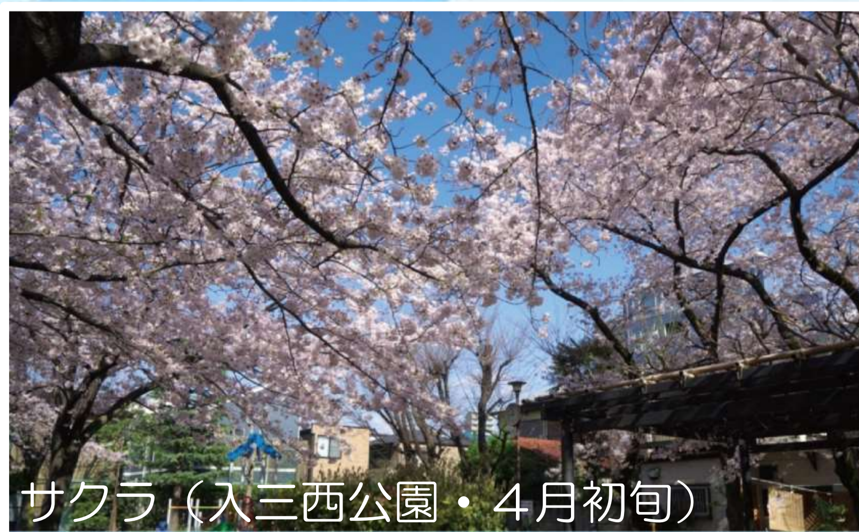
サクラ (入三西公園・4月初旬)