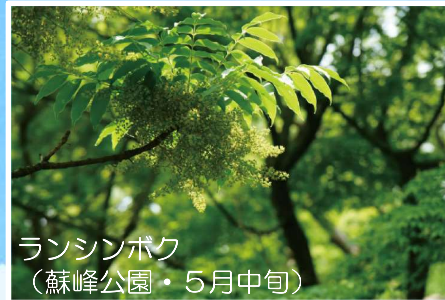
ランシンボク (蘇峰公園・5月中旬)