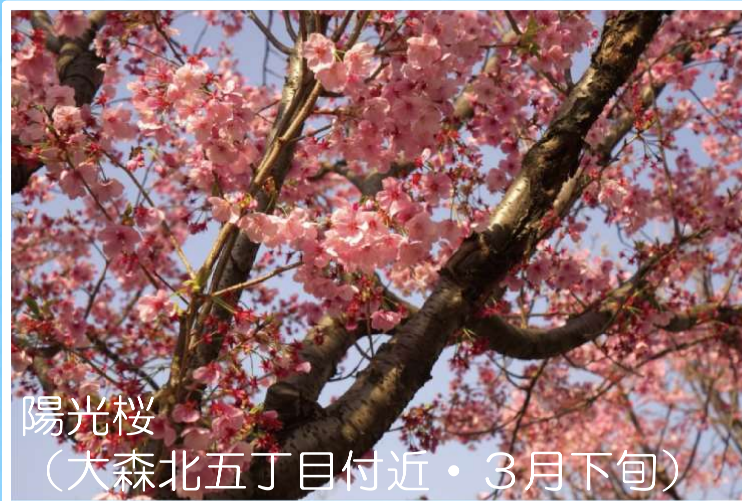
陽光桜 (大森北五丁目付近・3月下旬)