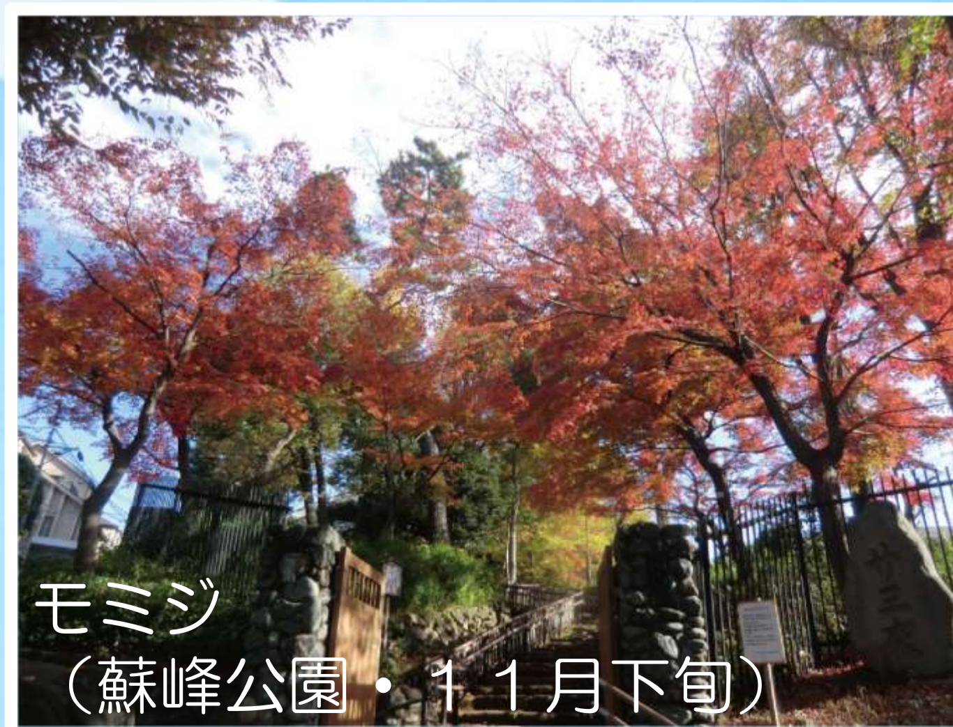
モミジ (蘇峰公園・11月下旬)