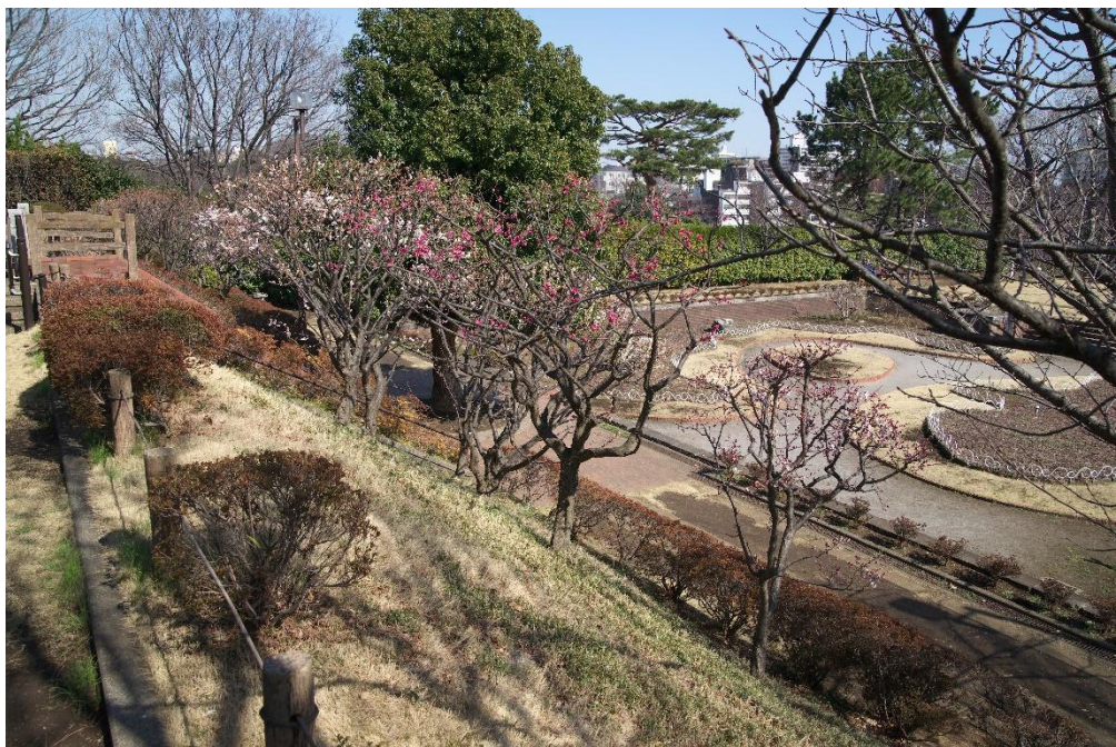
↑ ウメ（多摩川台公園）3月下旬 ↓