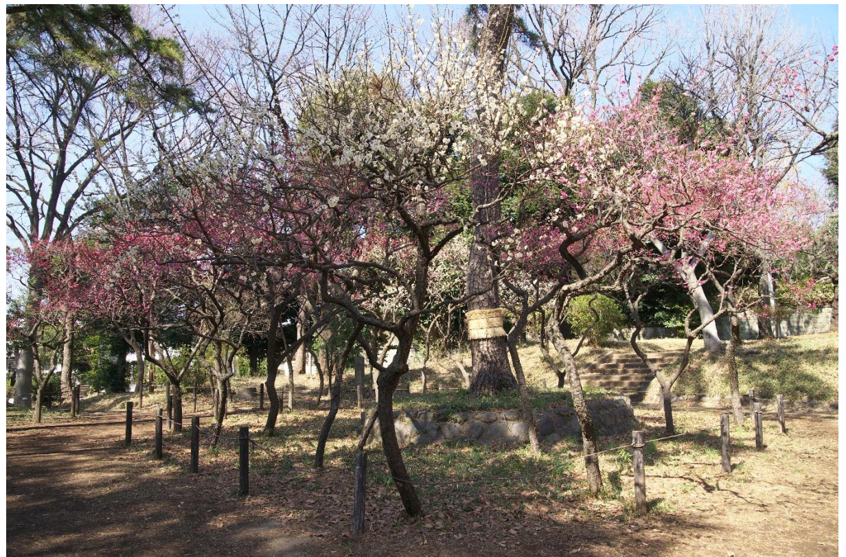
↑ ウメ (宝来公園) 3月頃