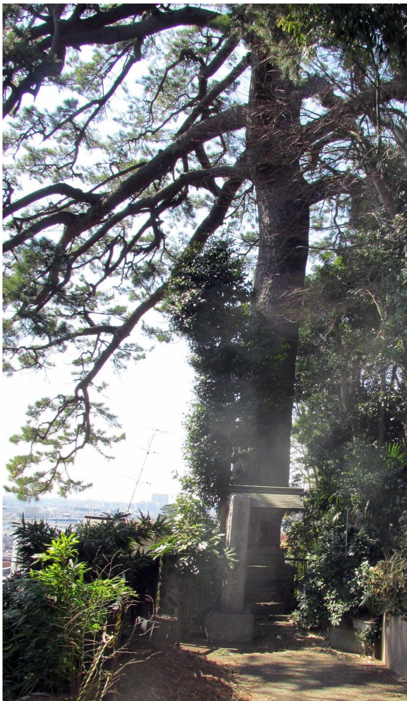
秋葉の黒松（東京都天然記念物）