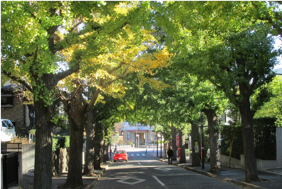
↑ イチョウ (田園調布駅付近)