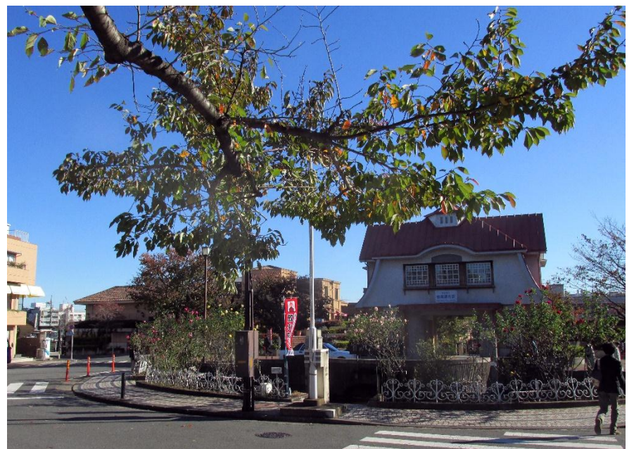
↑ 花壇 (田園調布駅ロータリー)