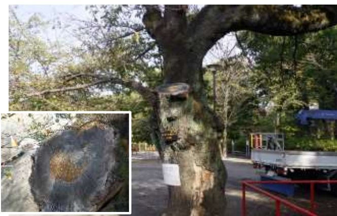
伐採前(幹、大枝の損傷)