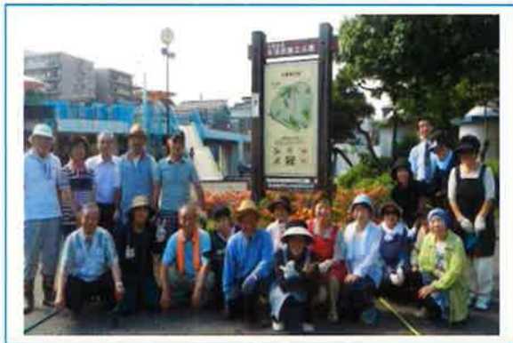
地域の「居場所」 「コミュニティカフェ」

被災地支援も 今年も花壇にひまわりを種 から育て、百五十本が元気に 咲きました。小学生たちとひ まわりの種を採取して福島県 に送る「福島プロジェクト」 も昨年から始めました。文通 で被災地支援ができる試みも、 ふれあいパーク活動を通じて 公園と縁ができたからです。