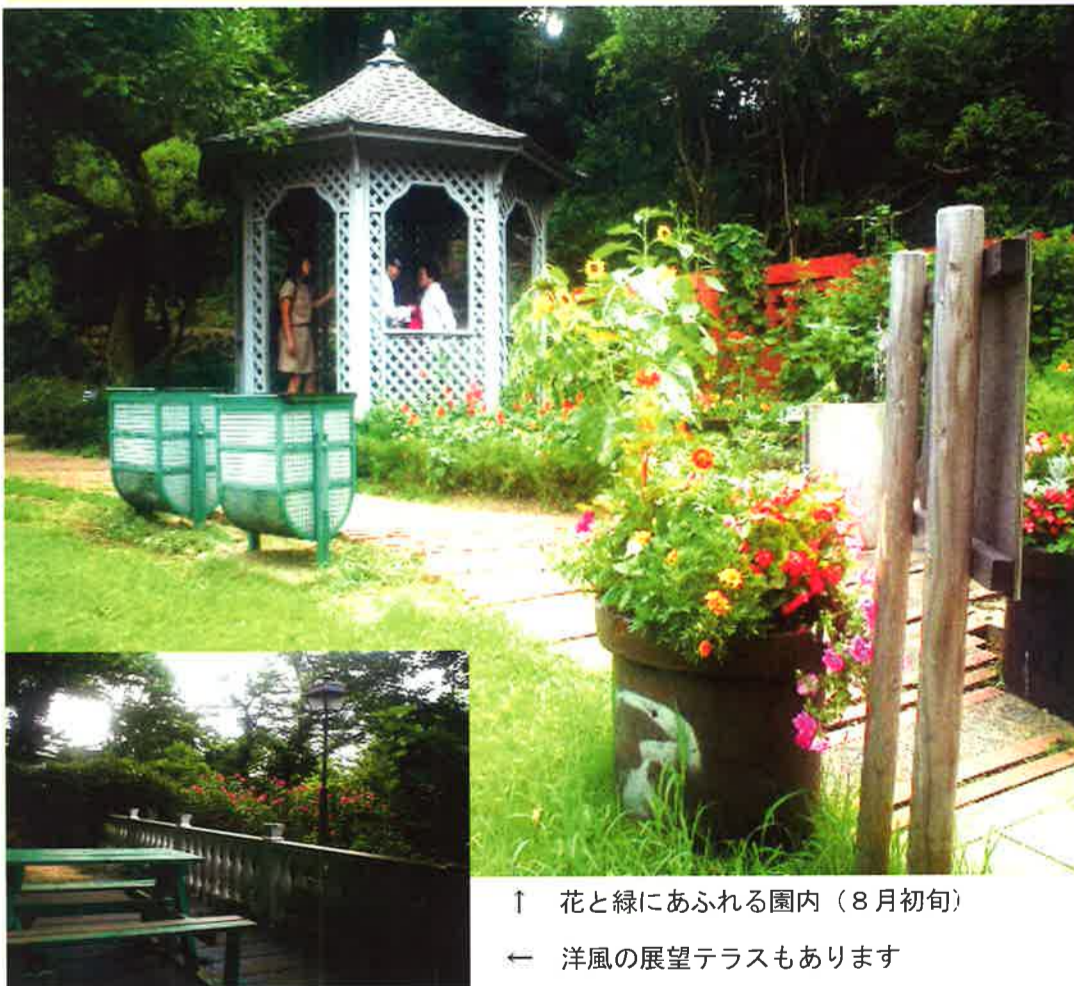
↑ 花と緑にあふれる園内(8月初旬)