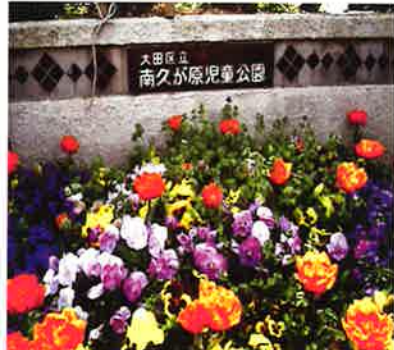
南久が原児童公園