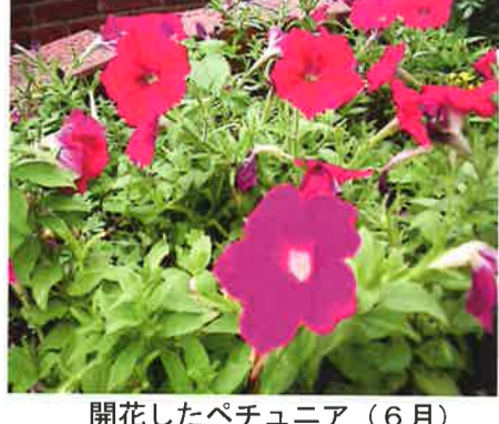
開花したペチュニア(6月)

当日は天候にも恵まれ、暖かい日和の中、3千株もの苗が1時間程でポットに移され、あっという間に作業が終わりました。