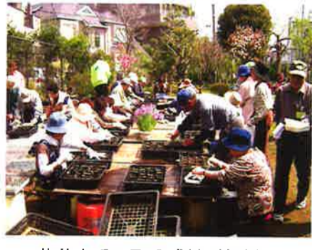
花苗を手取る感触が新鮮!

春の「ポット上げ作業」、秋には花を用いた「染物実習」も実施! 平成17年4月10日(日)南久が原園場(ほじょう)において、「花苗のポット上げ作業」が行われました。当日は大田西管内のふれあいパーク活動団体のメンバーを中心に40名以上の参加がありました。 また、10月1日(土)には、「秋の花づくり」と「染物実習」が行われました。