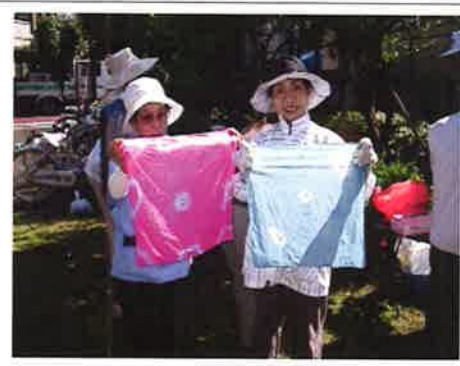
きれいに染まりました!

◆「秋の花づくり・染物実習」 10月1日(土)ヒオラ等の苗植え作業を行いました。忙しい中、メンバーが自分で育てた花は、その喜びに込めるかのように、長い期間咲き続けていました。