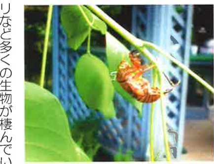
小さな自然があふれています (アブラゼミ幼虫の抜け殻)

「今度はどんな花を植えようか、皆でお茶を頂きながら話し合おうのが、何よりの楽しみ...!」 「春はもっと多くの花でいっぱいになりますよ...!」 そう話してくれたメンバーの笑顔がとても印象的でした。手入れの行き届いた園内の草花は、メンバーが挿し木で増やしたり、自宅から苗を持ってきて植えるなど工夫がされています。