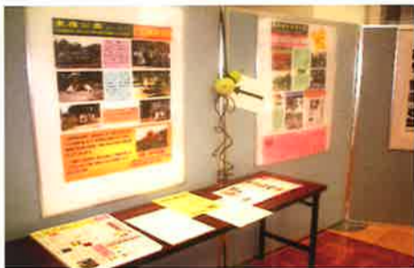
パネルによる活動の紹介の他、活動団体による資料も展示

「ふれあいパーク活動」での、さまざまな課題を解決するヒントを学ぶために協働実験塾「ふれあいパーク活動いろは塾」を開催します。