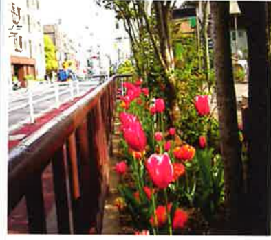
久が原二丁目児童公園

今春、ふれあいパーク活動で花壇活動をしている公園では、たくさんチューリップ・パンジー等の花で彩られていました。公園利用者・通行者・近隣の方々を楽しませてくれました。