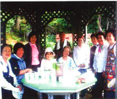
花清水弁天会の皆さん

花清水弁天会では、ふれあいパーク活動として、園内の草木の手入れや清掃などを行っています。また、月に2回は、グループのメンバーが、西洋風あつまや(右写真)に集まり、持ち寄りながら、今後の活動について話し合います。