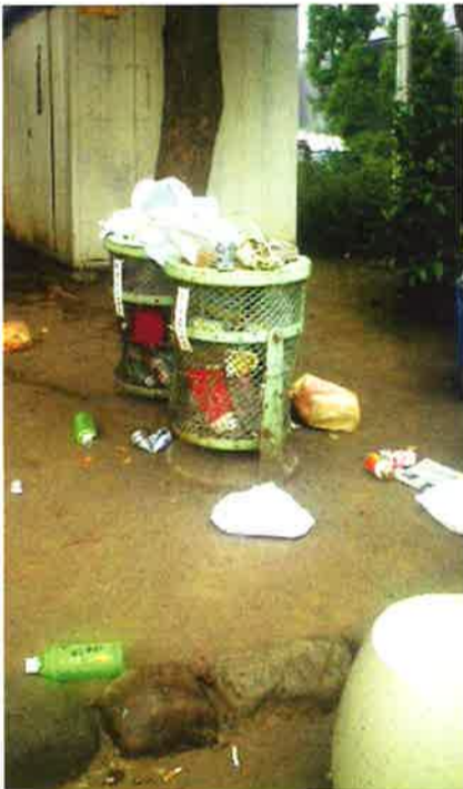
公園のゴミ箱の問題について、皆さんのご意見をお待ちしています

お弁当がふれかえってしまっています。皆さんの公園ではどうされていますか? ◆意見等、お待ちしております