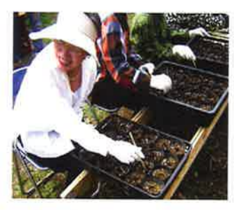
花苗を一つひとつ丁寧にポットに移していきます

同じふれあいパーク活動をしているグループ同士が共同で活動したのは、今回が初めてのケースで、大変有意義なものでした。