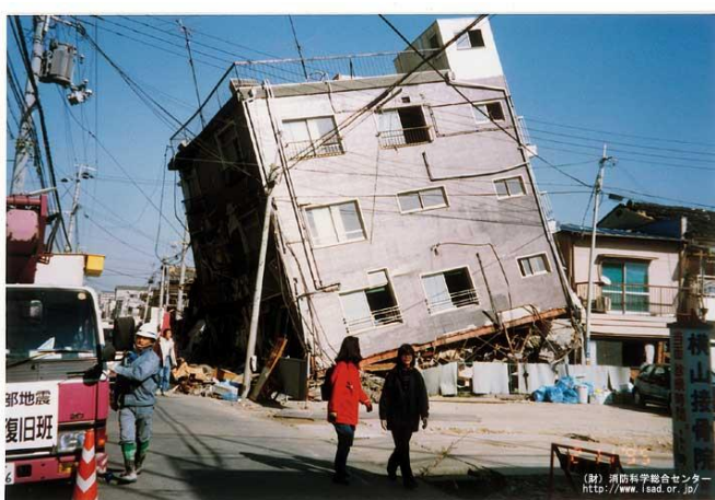
地震により建物が倒壊した様子

昭和56年5月31日以前に新築の工事に着手した、いわゆる旧耐震基準と呼ばれる建築物は、地震の揺れに対する強度が不足している可能性が高くなっています。阪神・淡路大震災では、旧耐震基準の建物が大きな被害を受けました。