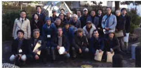
▲当日の参加者（会員16名ほか）

事例視察では、住民と行政が一丸となって、道路・公園の整備や不燃化の促進、地区まちづくりルール（地区計画）の実践をしている様子等を見学することができました。