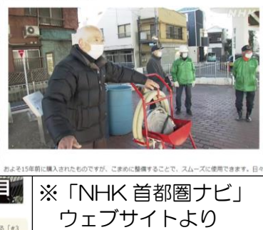
※「NHK 首都圏ナビ」ウェブサイトより