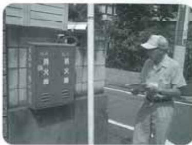
街なかにも消火器が設置されています

一般的な消火器は、消火薬剤を加圧充填されたガスによって勢いよく噴射して使います。万一、消火器本体にサビによる腐食やホースの詰まりなどがあると、破裂する危険もあります。このため、使用有効期限を定め、消火器本体に表示しています。もし期限が切れている場合は、販売会社に回収をお願いします（家庭ゴミではありません、一般に回収費用がかかります）。