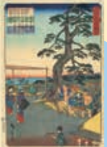
二代歌川広重 「江戸名所図会 八景坂夕栄」文久2（1862）年