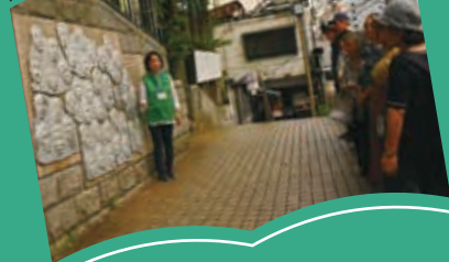
大森駅前、馬込文士村レリーフ前でのガイド風景