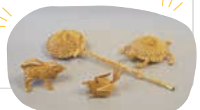
麦わら編み細工（会員作品）