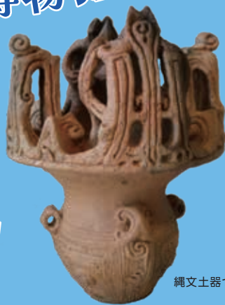
縄文土器づくりの会 作品 小林幸治作