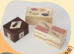
麦わら張り細工（会員作品）