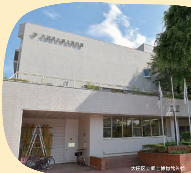
大田区立郷土博物館外観