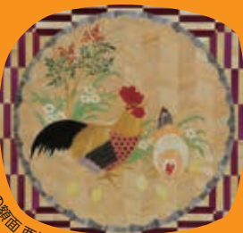
葛飾北斎下巻「十二支の顔(酉)」の復元作品 鈴木百合子作