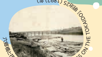
六郷橋に築き場（「SIGHTS AND SCENES ON THE TOKAJI」）