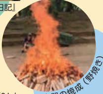
目黒川（1931）土器の焼成（野焼き）