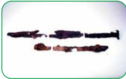
大刀 (東京都江戸東京博物館所蔵)

墳形：前方後円墳(1号墳)・円墳(3～8号墳)、不明(2号墳) 出土遺物：大刀・金環・鉄鏃・須恵器・円筒埴輪など 特徴：1～8号墳が列状に並んでいます、それぞれで造られた時期が異なります。