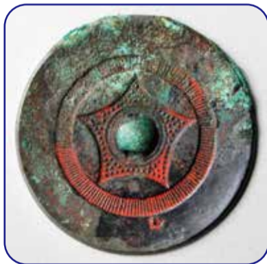
れんこもんきょう 連弧文鏡

墳形：円墳？ 出土遺物：銅鏡・鉄剣など 特徴：現在墳丘は残っていませんが、「扇塚」の石碑が道路沿いに建っています。