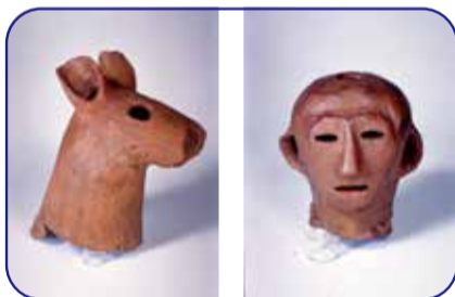
鹿形埴輪・人物(男子)形埴輪 (いずれも浅間神社所蔵・非公開)

墳形：前方後円墳 出土遺物：朝顔形埴輪・円筒埴輪・形象埴輪など 特徴：墳丘の上に浅間神社が建ち、墳丘の下の地中には縄文・弥生時代の遺跡もあります。