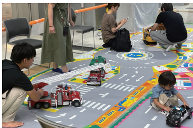
大きなおもちゃでAsobo!