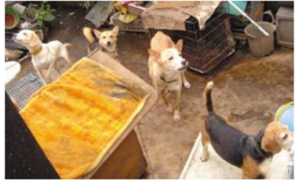
劣悪な環境に置かれた犬たちは、ストレスで吠えるなどの異常行動を示します。このような場所に飼えなくなった犬や猫を置いていく人も同罪といえるでしょう

安易に数を増やした結果、飼い主の経済力や世話がおいつかないため、犬や猫は十分な食餌も水も与えられず、糞尿の掃除も行き届かない劣悪な環境の中に閉じ込められます。このように世話を怠って犬や猫を苦しめるのは虐待です*1*2。人との温かいふれあいもなく、体も心も不健康な状態に置かれた犬や猫は健康状態も悪く、社会性もなく、人に慣れていないため、飼い主の生活が破綻し行き場を失ったとき、新しい飼い主をみつけるのは困難を極めます。自治体や動物愛護団体などが協力して新しい飼い主をさがす努力をしますが、全てに温かな家が見つかるとは限りません。