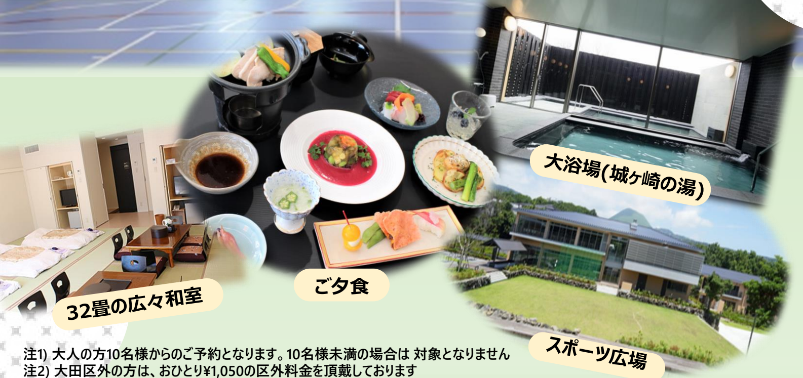
大浴場(城ヶ崎の湯)

“健康的で伊豆らしい特別な食事”と“体育室2時間貸切り”を含む、お得な限定プランです。