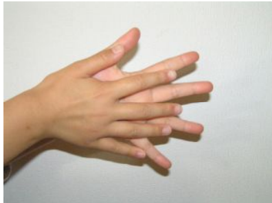
石鹸をつけ手のひらをよくこする