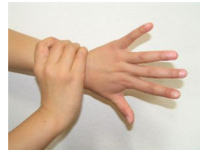
手首も忘れずに洗う