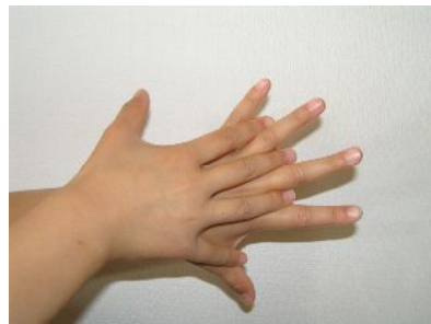
手の甲を伸ばすようにこする