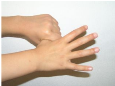
親指と手のひらをねじり洗 する