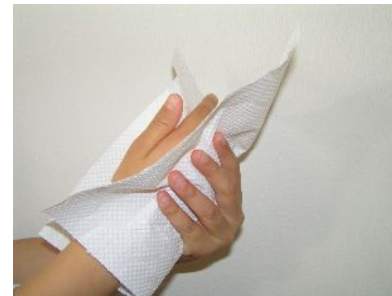
十分に水で流し、 清潔なタオルやペーパータオルで よくふき取って乾かす