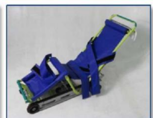
▲キャリダン(非常用階段避難車)