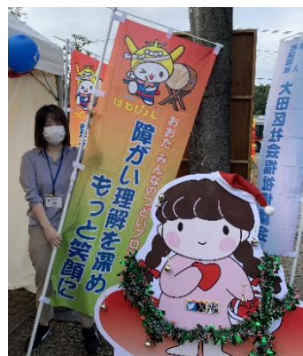
■ OTA ふれあいフェスタプロジェクトと社協のあいちゃん